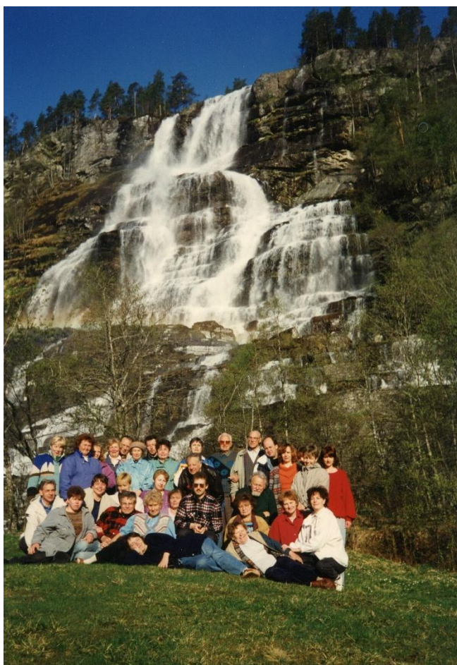
Pedagoģijas un psiholoģijas katedras kolektīvs pieredzes apmaiņā Norvēģijā.

Iespējams tieši sadarbība ir pamats novadītām 66 doktora disertācijām pedagoģijā , kuru autori ir gan Latvijas, gan Vācijas pētnieki. A. Špona lepojas ar raženo skaitu un vēl aizvien sava darba kabineta galdu sauc par doktorantu galdu.