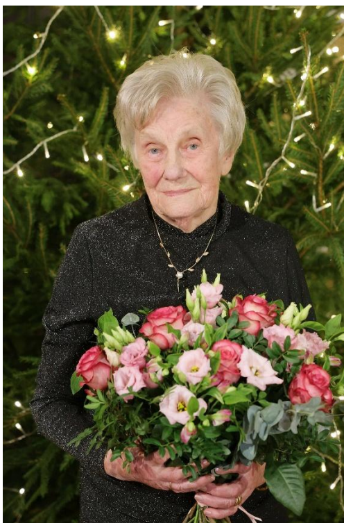
A. Špona Lielajā aulā 2024. gada 18. decembrī.

izcilu mūža ieguldījumu pedagogijas zinātnē un augstākajā izglītībā Latvijā” un iecelta par Atzinības krusta komandieri.