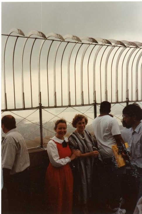
1989. gadā dalība konferencē Amerikā, Ņujorkā. Fotografijā brīvais brīdis uz “Empire State Building”.

Gan PPK, gan PPI laikā svarīgi bija nodibināt starptautiskus sakarus topošo pedagogu izaugsmei un pieredzes apmaiņai. Šajā laikā tika izveidoti plaši zinātniskie sakari ar vairākām ārvalstu augstskolām - Igaunijas, Lietuvas, Izraēlas, Šveices, Austrijas, Vācijas, Zviedrijas, Norvēģijas, Spānijas (Špona, 2013, 18).