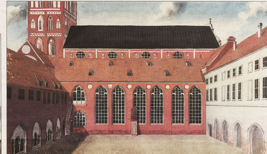
Doma krusteja. J. Broces zīmējums. Otrā stāva zālē bija «Bibliotheca Rigensis» sākotnējās telpas.