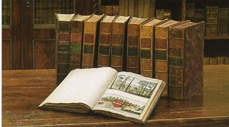
Коллекція Йохана Кристофа Бротце Monumente The collection of Brotze Monumente

За підтримкою Фонду суспільної інтеграції у 2004 році було розроблено проект "Історичне відображення співіснування народностей, що населяють Латвію, у роботах Й. К. Бротце" і створено галерею зображень людей різних національностей, де можна побачити й українців.