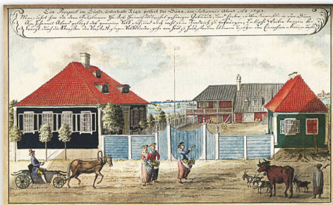
Рига. Янов вечір у Зунді. 1793

course of time, but information about them has been preserved in Brotze's drawings and descriptions stored in the library.