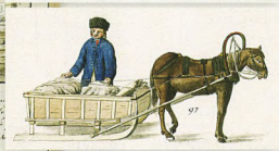
Латвія / Latvians