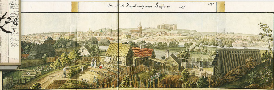
Tartu. 1797 / Tartu. 1797

й практичні дослідження можливостей заміни унікальних оригіналів їхніми електронними копіями.