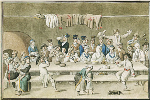
Весілля естонських селян / Estonian peasant wedding