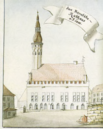
Таллінн. Ратуша. 1800 Tallinn. Town Hall. 1800

Academic Library of the University of Latvia 10 Rupniecības str., Riga, LV 1235, Latvia E-mail: acadlib@lib.acadlib.lv http://www.acadlib.lv