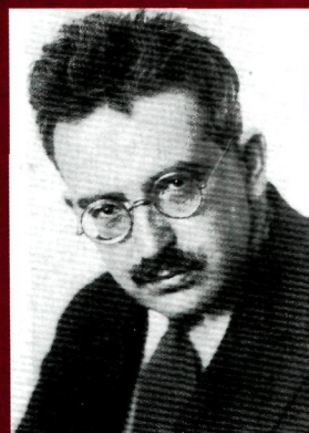
Romantiskais sapņotājs Valters Benjamins.