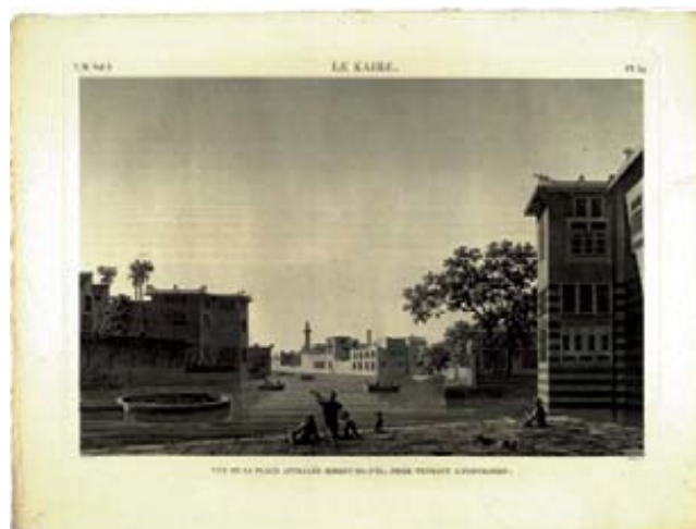
Kaira. Skats no Birket-el-Fyl laukuma plūdu laikā

Vēsturiski ilustratīvo un mākslinieciski vērtīgo gravūru kolekciju veidoja franču zinātnieki Napoleona Ēģiptes ekspedīcijas laikā no 1798. līdz 1801. gadam. Gravūras ir vairāk nekā 150 slaveno dažādu nozaru zinātnieku un pētnieku sadarbības rezultāts, viņi pavadīja Napoleona ekspedīcijā uz Ēģipti. Vēlāk, palīdzot aptuveni 2000 māksliniekiem, kartogrāfiem, burtličiem, kā arī 400 gravieriem, tika sagatavots minētais izdevums. Lielformāta gravūrās redzamas piramīdas,