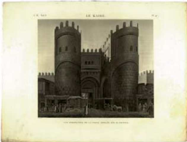
Kaira. Skats uz Bab El Foutouh vārtiem

tempļi, skulptūras un bareljefi, hieroglifu raksti, augi, dzīvnieki, pilsētas un to kartes.