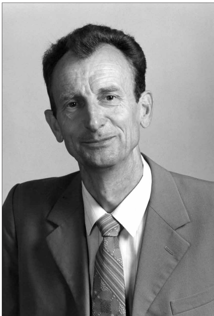
Akadēmiķis profesors Pēteris Cimdiņš