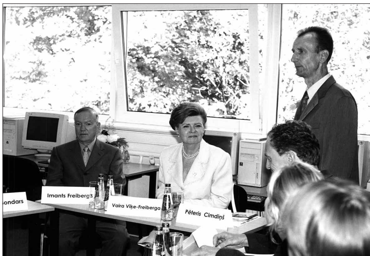
Valsts prezidentei Vairai Vīķei-Freibergai 2001. gada 23. augustā viesojoties Vidzemes Augstskolā.