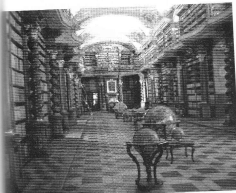
Čehijas Nacionālā bibliotēka. Baroka bibliotēkas zāle, atvērta 1722.gadā

Viena no redzamākajām Čehijas Nacionālās bibliotēkas struktūrvienībām ir Komunikāciju centrs, ko veido Sabiedrisko attiecību un mārketinga nodaļa, Izstāžu nodaļa, Starptautisko attiecību nodaļa un Izdevniecība ( Publishing Division ), kas sastāv vēl no trim atsevišķām nodaļām. Sabiedrisko attiecību un mārketinga un nodaļā strādā deviņi darbinieki, kas visdažādākajos veidos cenšas "spodrināt" bibliotēkas tēlu un piesaistīt finansējumu. Piemēram, 2006.gadā par bibliotēkas ģenerālsponsoru kļuva slavenā čehu alus darītava "Budweiser Budvar". Nodaļa organizē arī atvērto durvju dienas, sastāda dažādus informatīvus