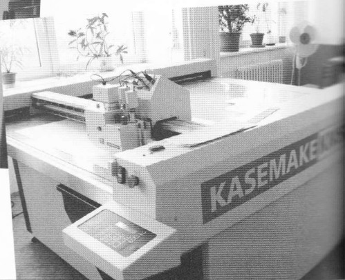
Firmas "Kasemake" kartona kastīšu robots, kas no speciāla kartona katrai grāmatai izgatavo piemērotu kastīti, apdrukājot to arī ar nepieciešamo šifru.