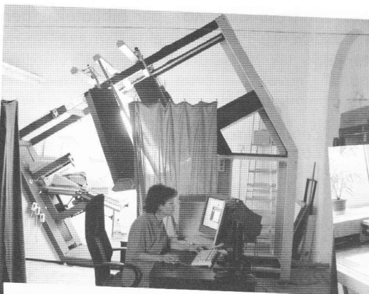
Čehijas Nacionālās bibliotēkas galvenais skeneris ar 70 megapikseļu digitālo fotokameru. Konstruējusi firma "Aip Beroun", izgatavots Vācijā