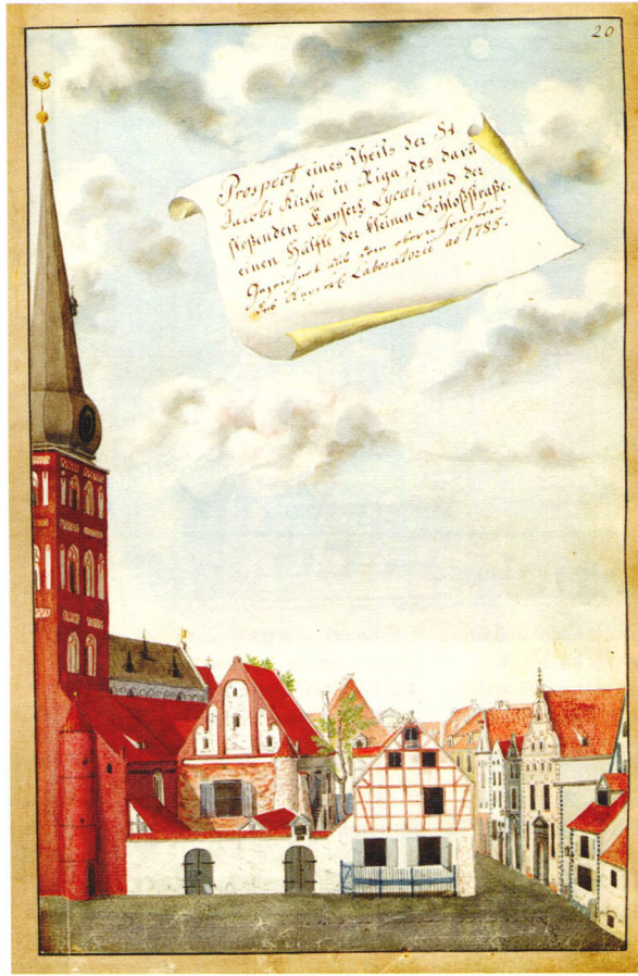
J. K. Broce. Rīgas Ķeizarišķā liceja prospektis 1791. gadā. Akv. Brotze Monumente 4, 203; Broce Zīmējumi un apraksti 1, 127.

☐ J. K. Broce. Ķeizarišķā liceja projekts: 1. un 2. stāva plāni. [1784. II]. Tuša, tinte, zīm. LVVA, 30. f., 1. apr., 8.l., 38a lp.