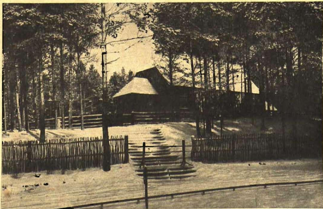
Usmas baznīca Brīvdabas muzejā