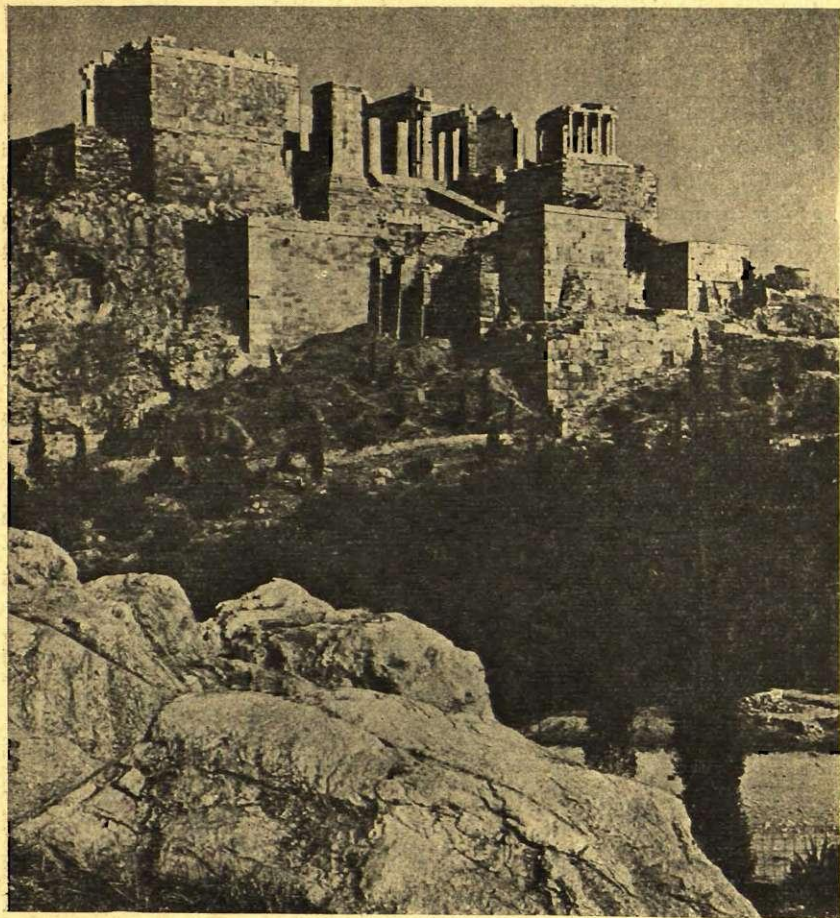
Skats no Areopaga (Atēnās) uz Akropoli.

maino būtību. Dziļā bijībā un laimē stāvēdams lielā brīnuma priekšā, cilvēks reizē izjūt kautru vēlēšanos, kaut viņam būtu dots neizsakāmi lielo, ko viņš pārdzīvo, izteikt, izteikt vārdos, žestos, darbos, lai pats apmierinātu savu neatvairāmo iek-