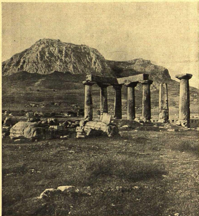
Senā Korinta ar Akrokorintu.

Nav brīnums, ka tādos apstākļos skaistais sapnis, kas iemiesojas baltajās akmens celtnēs un skulptūrās, uz brīdi pa-