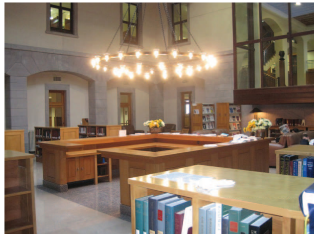
Ātrija zona Koçu Universitātes bibliotēkā

Kiraç AKMED Research Institute). Fonds finansē arī Starptautisko Stambulas biennāli ( The International Istanbul Biennale ; no 2007.gada), kuras mērķis ir veicināt modernās mākslas izpratni, īpaši jaunajā paaudzē, un Koçu festivālu ( Koç Fest ; no 2006.gada), kas ik gadu pulcē 250 000 studentu un noticis jau 45 Turcijas pilsētās.