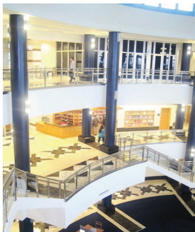
Sabanči Universitātes Informācijas centrs

ku apmācību programmas. Darbinieki viens otru neuztver kā konkurentus, bet kā draugus. Tas bija viens no lielākajiem pārsteigumiem prakses laikā!