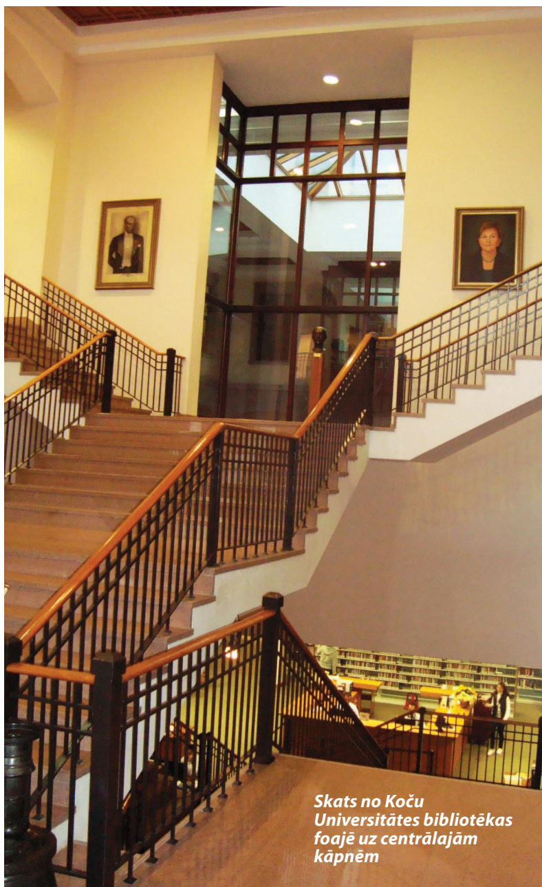
Skats no Koču Universitātes bibliotēkas foajē uz centrālajām kāpnēm

Abās pirmā stāva diennakts studiju hallēs, kurām ir arī atsevišķa ieeja no pagalma, bija īsta burzma. Šeit pieejama visa nepieciešamā tehnika (datori, printeri, kopētājs, skeneris, iesiešanas iekārta), izklaides žurnāli, avīzes, kas pēc 3 mēnešu lietošanas lasītāvās tiek izslēgtas no bibliotēkas krājuma, arī pārtikas automāti. Kā stāstīja darbinieki, vislielākais apmeklētāju pieplū-