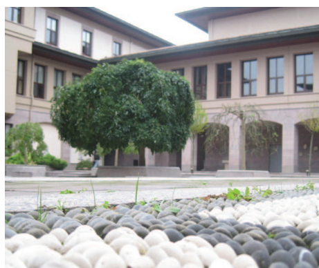
Oļu mozaika Koçu Universitātes Humanitārās fakultātes pagalmā

Koçu Universitāte (Koç University, KU) dibināta 1993.gadā. Tā ir privāta augstskola, kuru dibinājusi un sponsorē Koçu ģimene — viena no bagātākajām Turcijā. Tās pirmsākumus saista ar Vebi Koçu (Vehbi Koç, 1901–1996), kurš 1926.gadā sāka savu karjeru tēva pārtikas veikalā, pēc tam pievērsās automašīnu un elektrotehnikas ražošanai, bet vēlāk iesaistījās banku