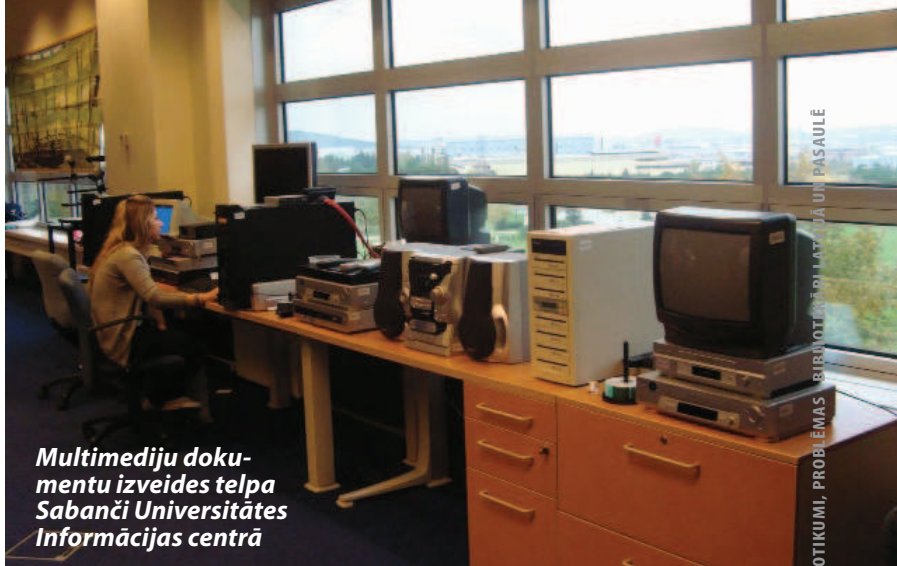
Multimediju dokumentu izveides telpa Sabanči Universitātes Informācijas centrā

Neskatoties uz Sabanči un Koču universitāšu konkurenci, bibliotekāri aktīvi sadarbojas — regulāri notiek tikšanās un pieredzes apmaiņa gan vadības, gan darbinieku līmenī. Abu universitāšu pārstāvji kopīgi apspriež aktuālos jaunumus bibliotēkās, diskutē par tehnoloģijām un informācijas produktiem, piemēram, radio frekvences identifikācijas tehnoloģiju ( Radio frequency identification, RFID ) vai datubāzu izmantošanu, lai izvēlētos labāko un ekonomiski izdevīgāko risinājumu. KUB darbinieki regulāri stažējas SUIC, un otrādi. Abas institūcijas ir iesaistījušās publisko bibliotēku darbinieku apmācībā un sadarbojas, izstrādājot publisko bibliotēku darbinie-