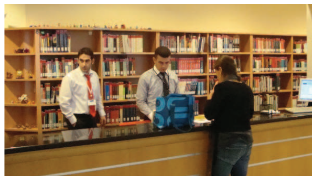
Lasītāju apkalpošanas zona Sabanči Universitātes Informācijas centrā

Haci Omer Sabancı Foundation [tiešsaiste]. Sabancı VAKFI, [b. g.] [skatīts 12.03.2011.]. Pieejams: http://www.sabancivakfi.org.tr/eng/ Koç University [tiešsaiste]. [Skatīts 12.11.2010.]. Pieejams: http://www.ku.edu.tr/main.php