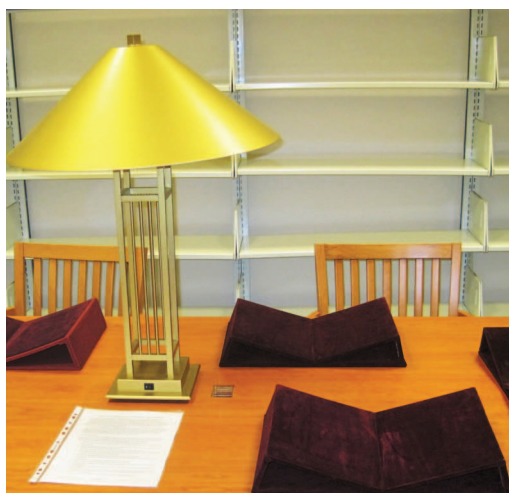
Koču Universitātes bibliotēkas Reto izdevumu lasītavā

Trīsstāvēģā kupolveida ēkā, kuras centrā ir lasītava, atrodas Sabanči Universitātes Informācijas centrs ( Sabancı University Information Center, SUIC ). Krājums,