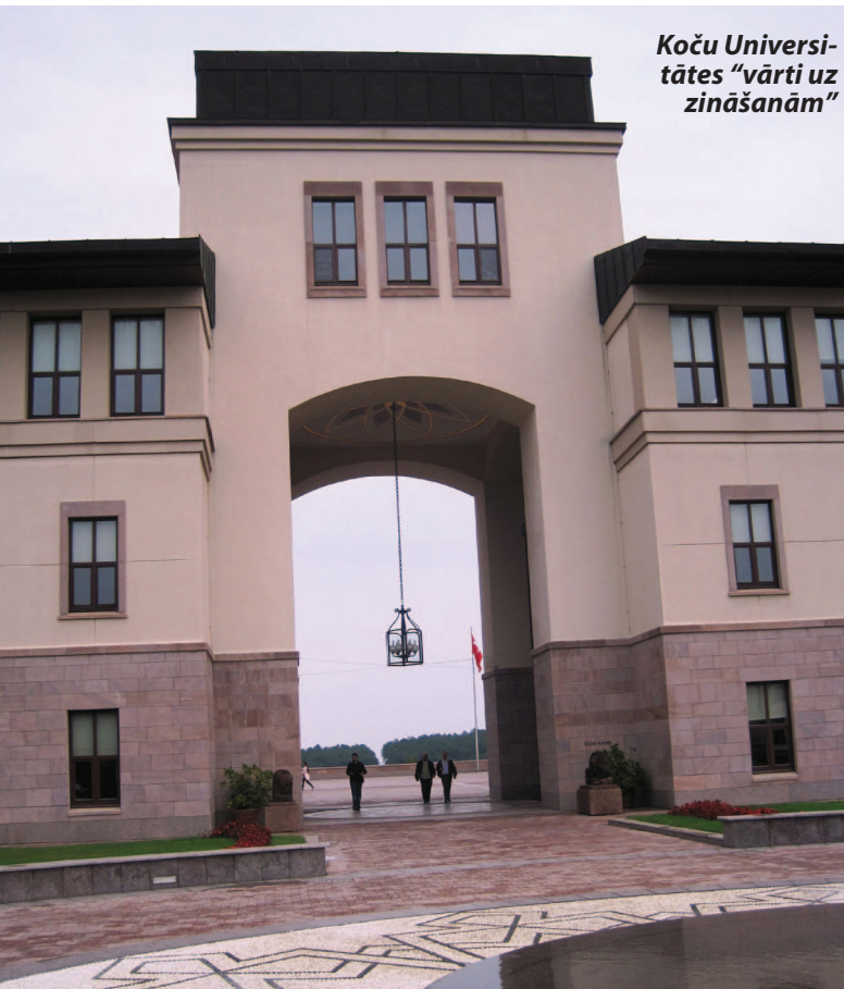
Koçu Universitātes "vārti uz zināšanām"

un brauciens ar sabiedrisko transportu no tām līdz pilsētas centram aizņem vismaz 1,5 stundu, dažādie finansētāji un attālumšis tās nešķir, jo tām ir viens mērķis un līdzīgi uzdevumi. Rakstā iepazīstināsim ar abiem dibinātājfondi, universitātēm, Koçu Universitātes Suna Kiraç bibliotēku un Sabanči Universitātes Informācijas centru.