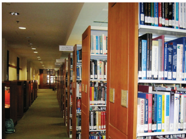
Individuālās darba vietas un krājums Koçu Universitātes bibliotēkā