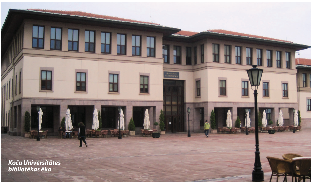
Koçu Universitātes bibliotēkas ēka