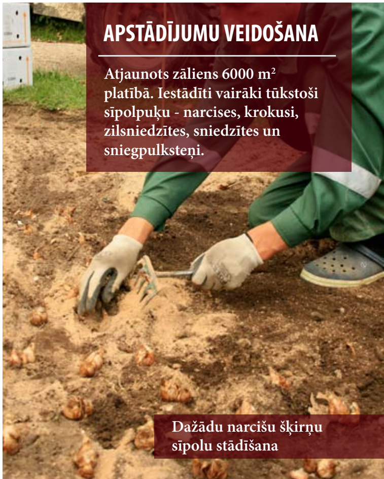
Dažādu narcīšu šķirņu sīpolu stādīšana

Atjaunots zāliens 6000 m 2 platībā. Iestādīti vairāki tūkstoši sīpolpuķu - narcises, krokusi, zilsniedzītes, sniedzītes un sniegpulksteņi.