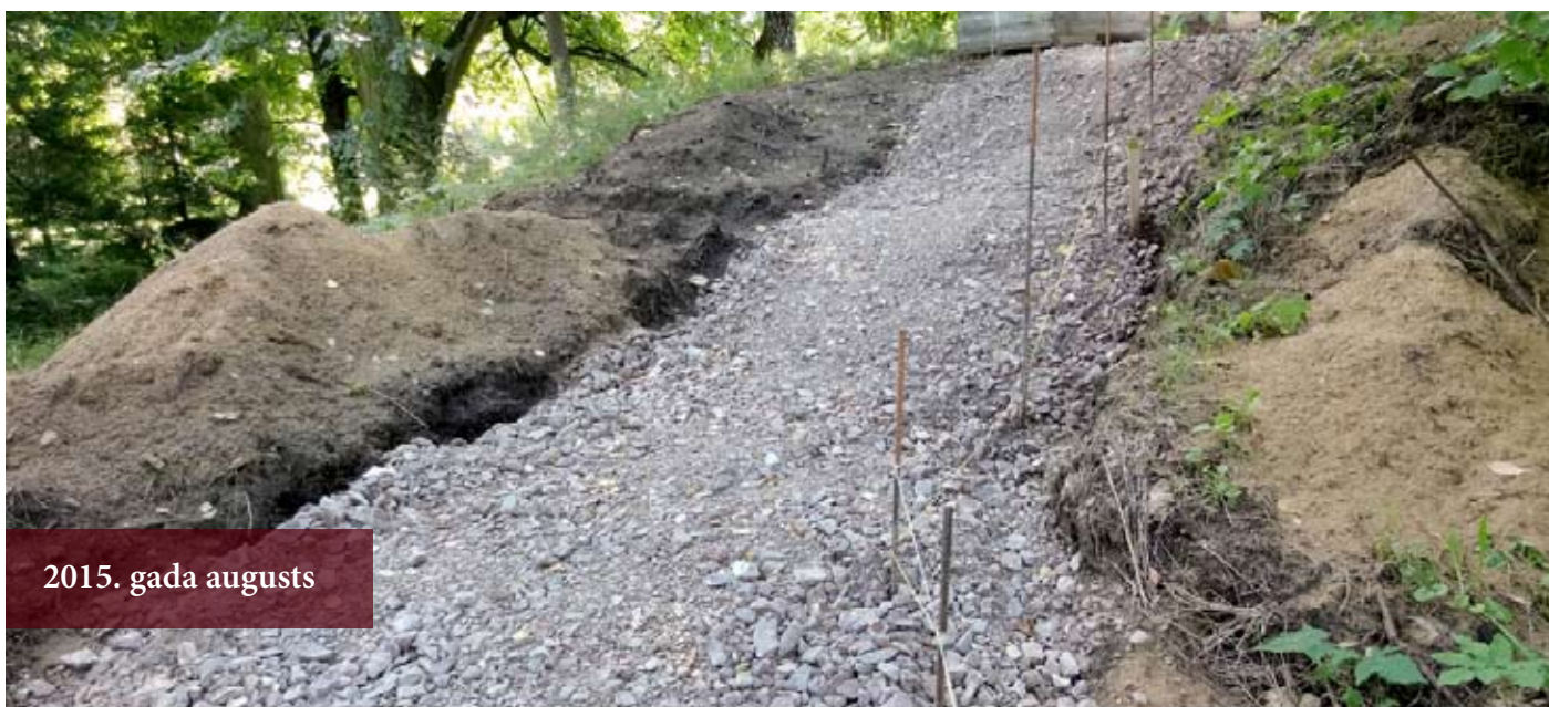
2015. gada augusts