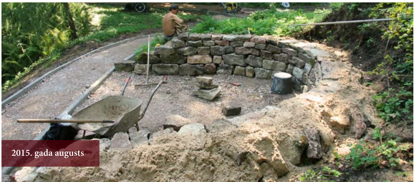
2015. gada augusts