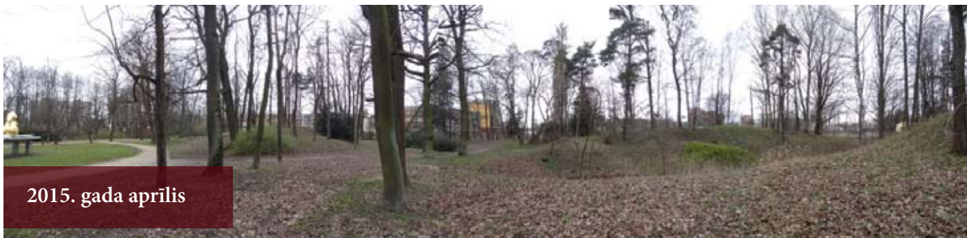
2015. gada aprīlis