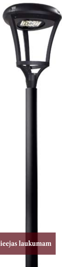
Laternas tips ieejas laukumam

Atjaunota kases māja, uzmontēta laterna ieejas laukuma izgaismošanai, izveidota dekoratīva norobežojošā siena āra tualetēm.