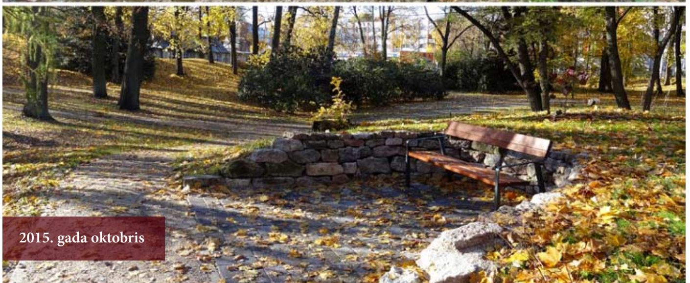
2015. gada oktobris