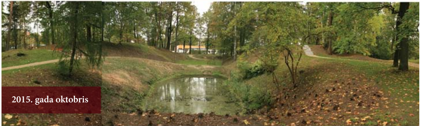
2015. gada oktobris