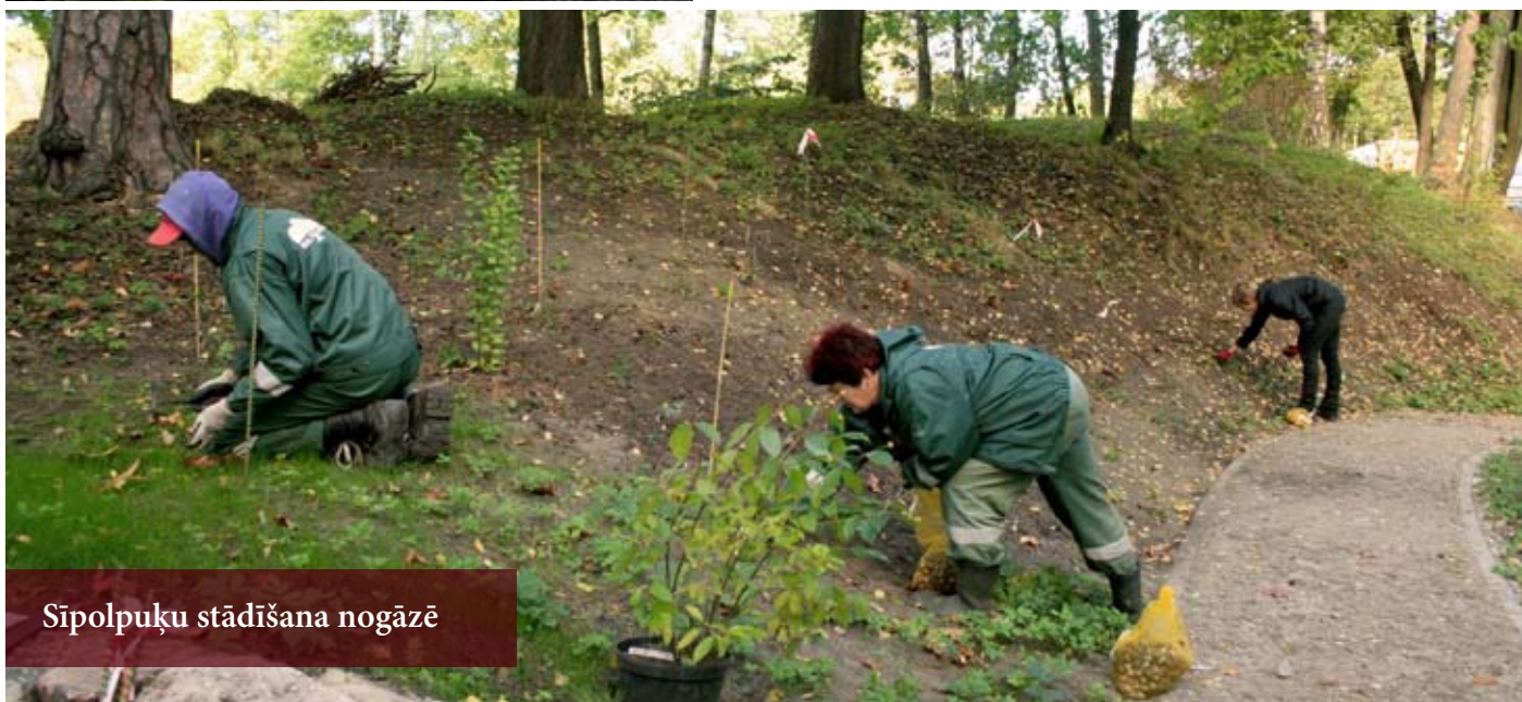
Sīpolpuķu stādīšana nogāzē