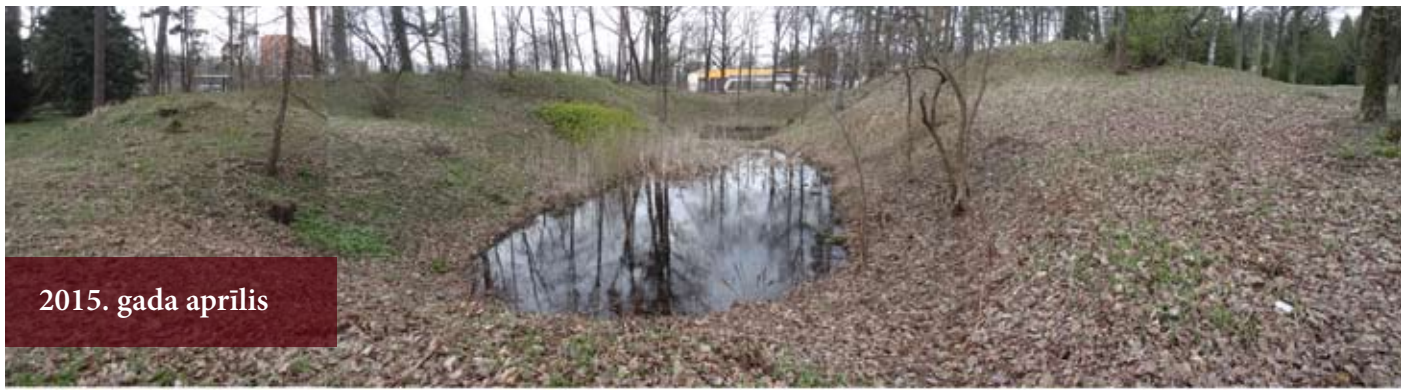
2015. gada aprīlis