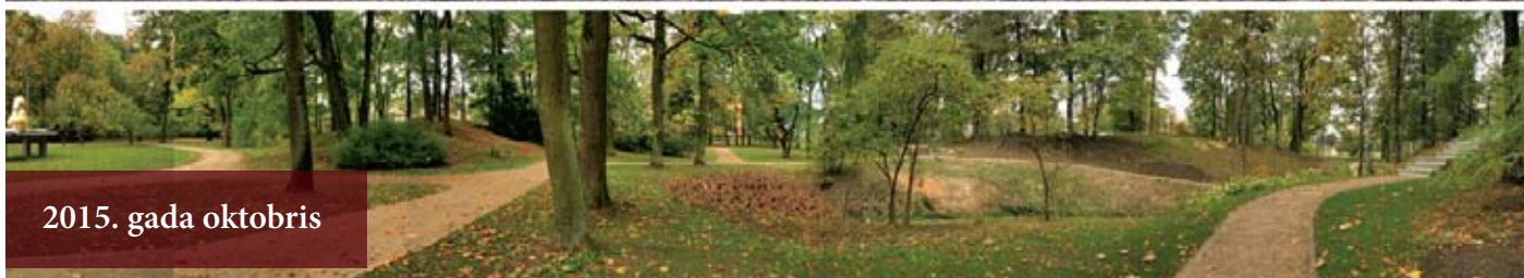
2015. gada oktobris