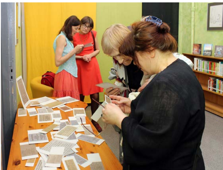
Muzeju nakts dalībnieki pārbauda savas zināšanas senu tekstu lasīšanā.