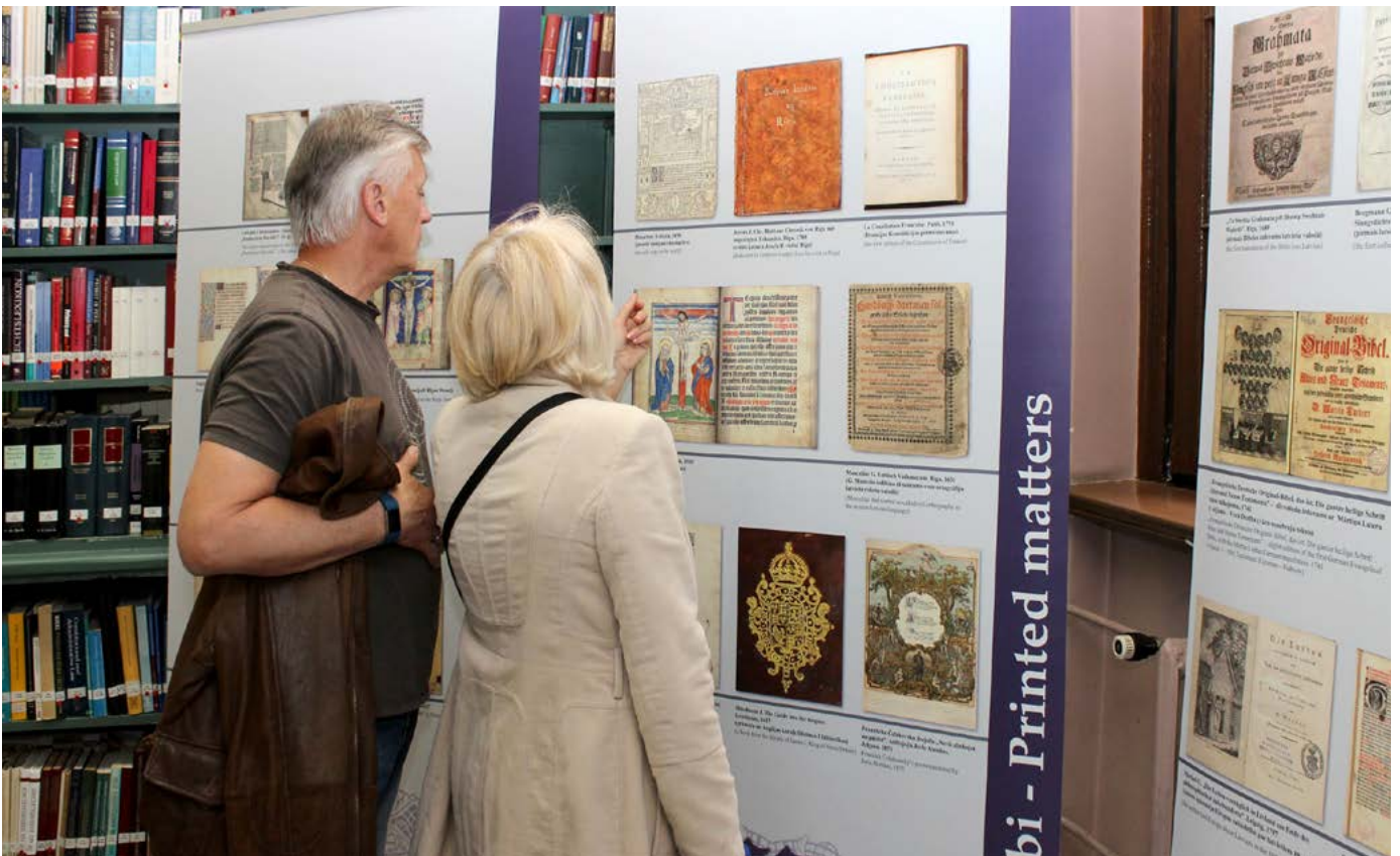
Muzeju nakts viesi iepazīstas ar ilustrācijām bagāto stendu izstādi.