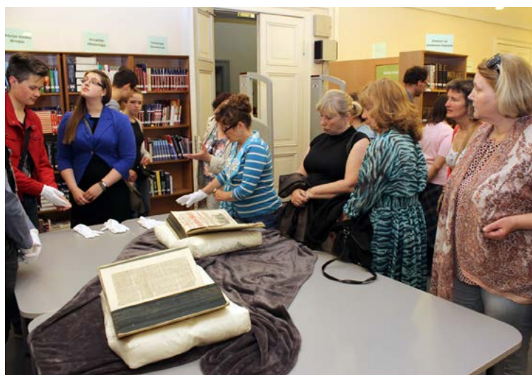
Apmeklētāji apbrīno apjomīgos reformācijas teologa Mārtiņa Lutera darbu izdevumus, kas pasaulē pazīstami kā "Leipcigas izdevums".