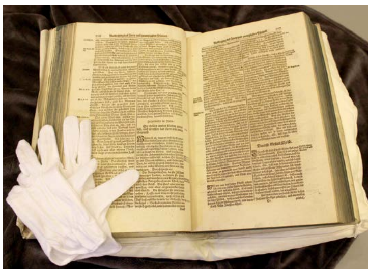
Dr. Mārtiņa Lutera Kopoto rakstu izdevuma atvērums.