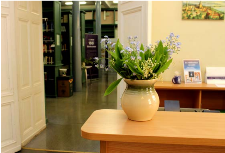
Pavasariģi uzpostās telpas LU Bibliotēkā Raiņa bulvārī gaida savus viesus.