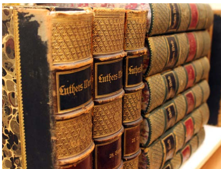
Veimārā izdotais Dr. Mārtiņa Lutera rakstu kopojums.