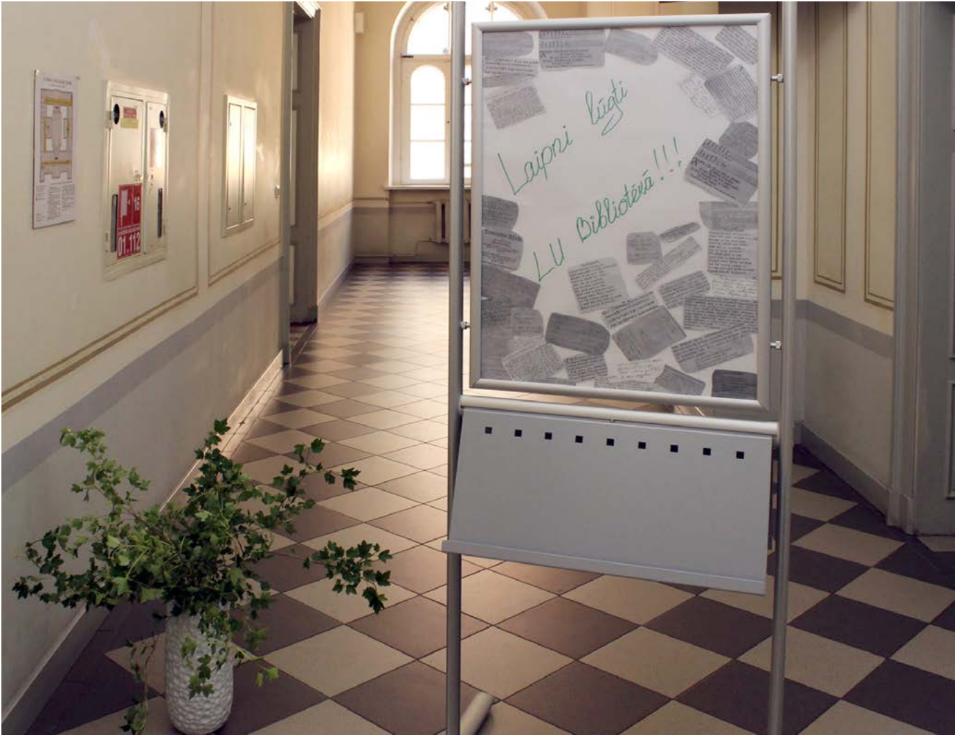
LU Bibliotēka Raiņa bulvārī gatava sagaidīt Muzeju nakts apmeklētājus.