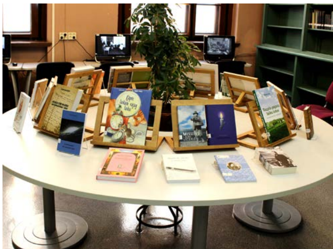
Grāmatu izstādē aplūkojami izdevumi, kuru nosaukumos ir iekļauts vārds "laiks", fonā redzamas vēsturiskās fotogrāfijas.

Pēc grāmatu meklēšanas ciemiņi varēja izmēģināt, cik raiti viņi prot lasīt senus tekstus ar raksturīgiem smailiem, stūrainiem burtiem latviešu un krievu valodā, kā arī tekstus latgaliešu un lībiešu dialektā. Par laika rituma klātesamību šajā aktivitātē atgādināja birstošie smilšu