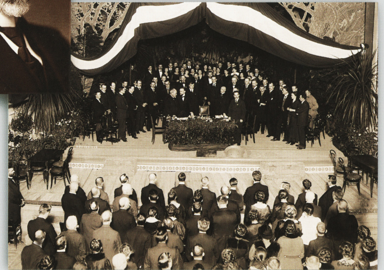
Latvian itsenäisyysjulistus ja tasavallan perustaminen 18.11.1918