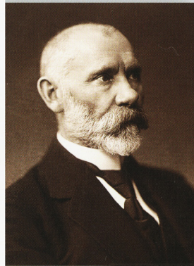
Jānis Čakste (1859–1927) – ensimmäinen Latvian tasavallan presidentti (1922–1927)

18. marraskuuta 2008 on Latvian tasavallan itsenäistymisen 90. vuosipäivä. Näyttely "Suomi ja Latvia – kulttuuriyhteyksiä kautta aikojen" avataan Suomen Kansalliskirjastossa Helsingissä 13. marraskuuta 2008. Latvian Akateemisen kirjaston näyttely luo katsauksen Latvian historiaan sekä Suomen ja Latvian välisiin yhteyksiin.