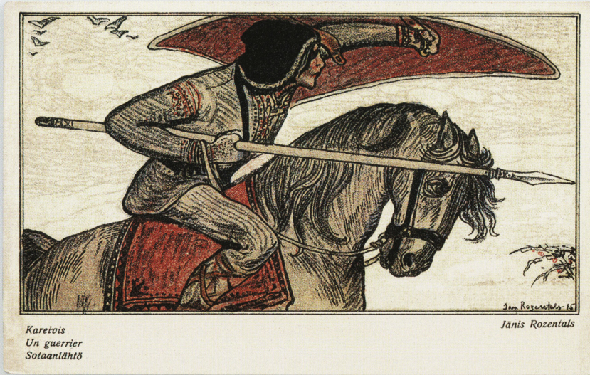
Kareivis Un guerrier Sotaanlähtö