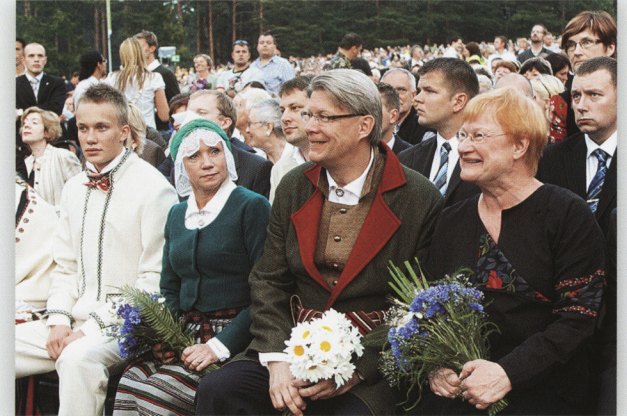
Latvian tasavallan presidentti Valdis Zatlers ja Suomen tasavallan presidentti Tarja Halonen

Suomen Kansalliskirjastossa, Unioninkatu 36, 00170 Helsinki