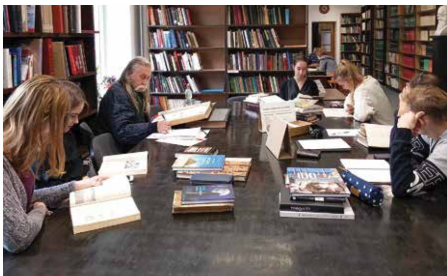
8. attēls. Latvijas Universitātes Akadēmiskās bibliotēkas Misiņa bibliotēkas lasītava Rīgā, Rūpniecības ielā 10.