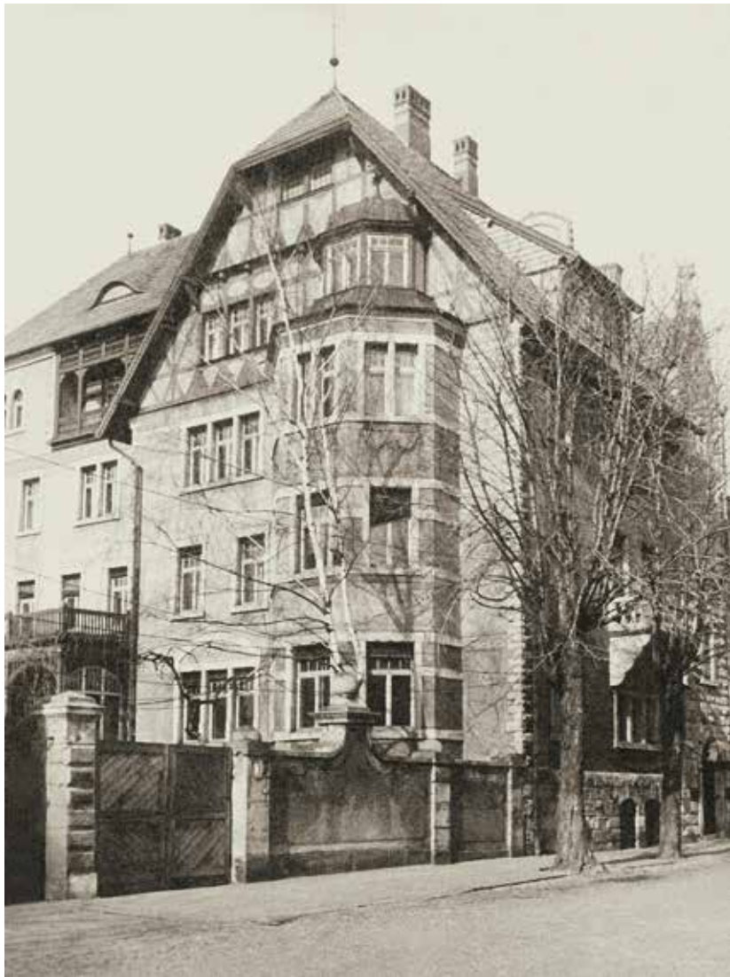
6. attēls. Ēka Rīgā, Skolas ielā 3, kur Mišņa bibliotēka atradās no 1945. līdz 1992. gadam. No LU AB MR kolekcijas