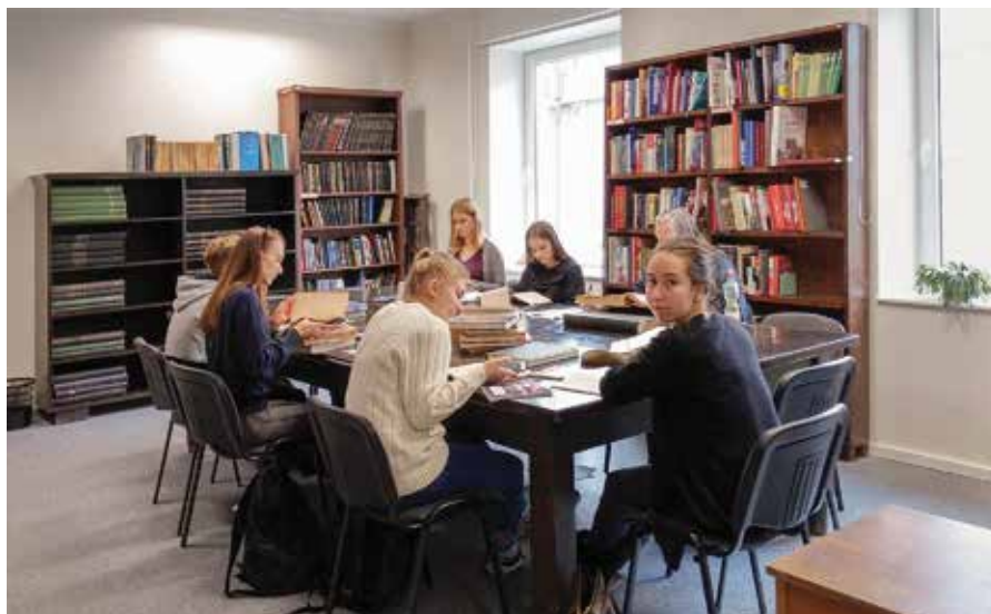
7. attēls. Latvijas Universitātes Akadēmiskās bibliotēkas Misiņa bibliotēkas lasītava Rīgā, Rūpniecības ielā 10.