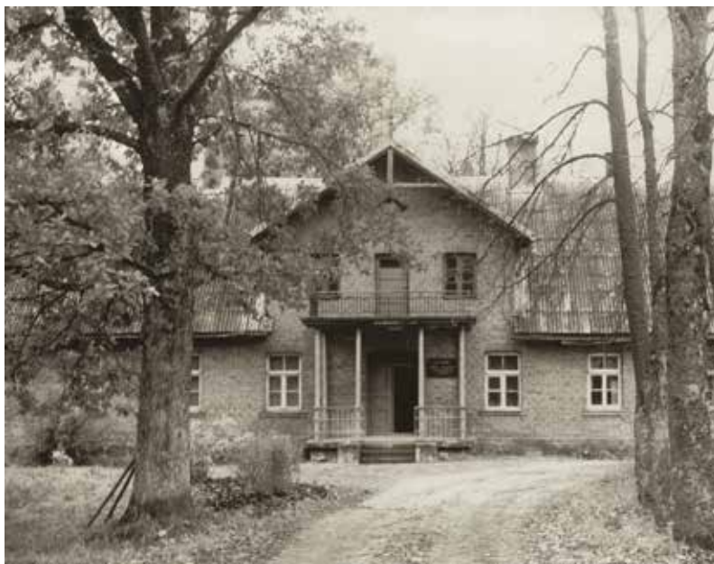
5. attēls. Jāņa Misiņa dzimtās mājas "Krāces".