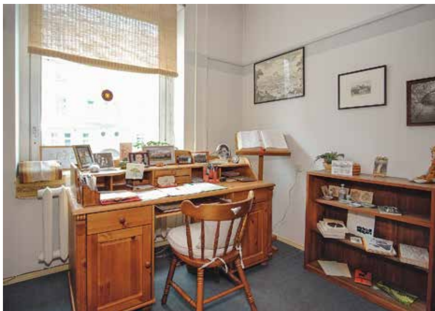
15. attēls. Dzejnieces Astrīdes Ivaskas rakstāmgalds.