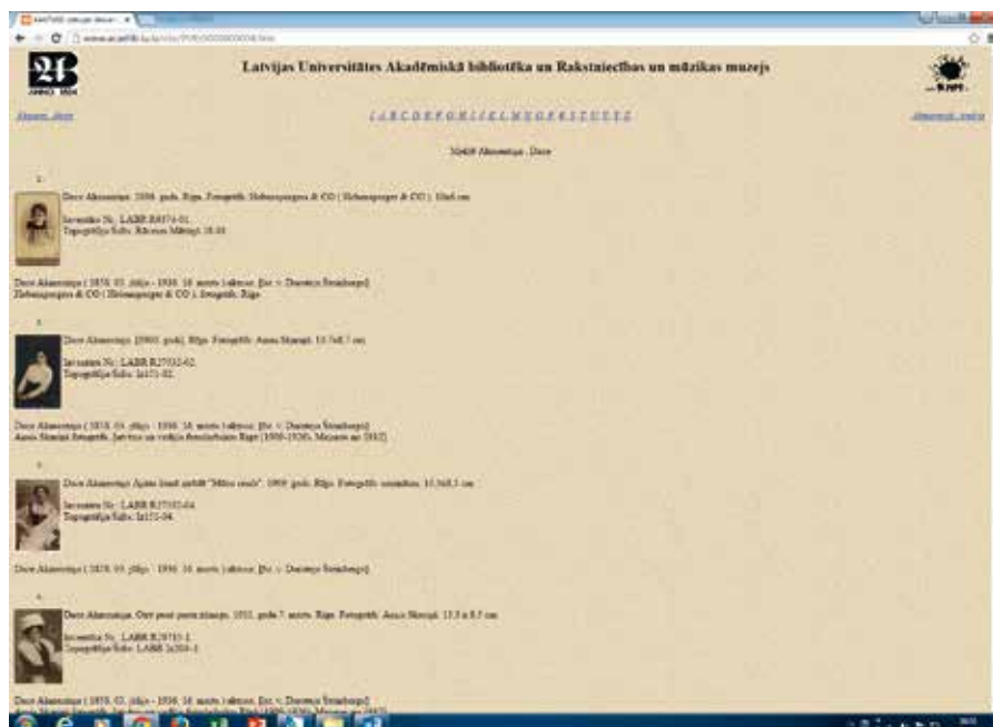
16. attēls. Tiešsaistes "Personu un vietu attēlu datu bāze", kopprojekts ar Rakstniecības un mūzikas muzeju