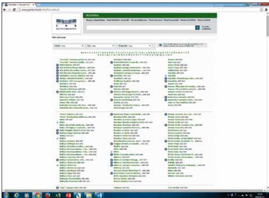
18. attēls. Latvijas Nacionālās digitālās bibliotēkas periodisko izdevumu saraksts