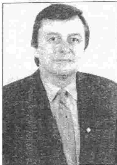
(Turpinājums no 1. lpp.)

Gada laikā fakultātē lekcijas lasījuši deviņi viesprofesori, tā papildinot studentu zināšanas tādos lekcijuursos kā "Reģionālā plānošana", "Vietu attīstība". Profesori bija no Kanādas, ASV, Lielbritānijas, Vācijas un Nīderlandes. Nav izdevies veikt fakultātē remontu. Tam ir objektīvi iemesli.