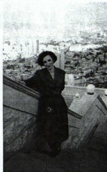
Raksta autore Ilze Haifa

Jautāju, vai ir privilēģijas sievietēm un vīriešiem profesijās? Agrāk bijusi tendence, bet šobrīd izzūd atšķirība starp sievietēm un vīriešiem profesijās, īpaši tas esot vērojams biz-