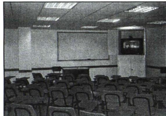
Videozāle - TV lekciju tilts ar ASV

mēnešos tiek apgūti kursi un turpmāk jaunākie iepazīstina ar savas zemes un tautas vēsturi, parāda ievērojamākās vēsturiskās un kauju vietas. Neuzbāzīgi, bet prasmīgi tiek ievērojams savas valsts patriotisms. Iespējams, arī pie mums Latvijā tas ir pieredzes apgušanas vērts pasākums.