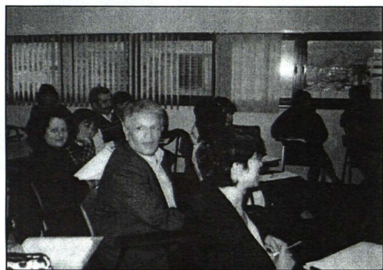
Studentu vidū ir arī kungi ar sirmām galvām. Mācīties nekad nav par vēlu, vai ne?

Telavivā videolekciju koordinētājs Josifs arī atbraucis no bijušās PSRS. Viņš sarunā atzinās, ka galvenā motivācija bijusi, lai viņa bērni varētu iegūt pilnvērtīgu un vispusīgu izglītību. Daudz jauniešu studē nevis Izraēlā, bet ārzemēs. Taču valdības politika ir motivēt un censties,