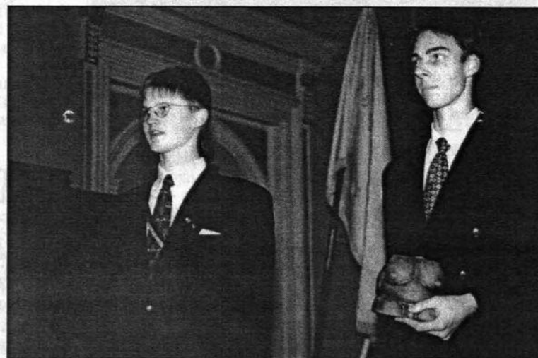
Apsveicēji no Igaunijas studentu apvienības