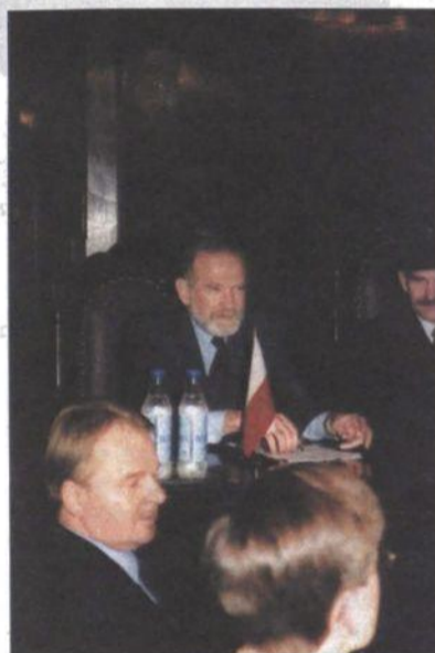
Polijas ārlietu ministrs Bronislavs Geremeks