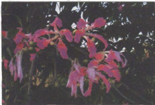
Valensijā šobrīd zied puķes ...

Pēc referāta nolasišanas, kas iezīmēja universitāšu vadošo lomu, mēs sadalījāmies piecās darba grupās, kurās kopā strādāja pārstāvji gan no Centrāleiropas, gan Austrumeiropas un Rietumeiropas. Vārds "globalizācija" tika minēts kopā ar vārdu "internacionalizācija"