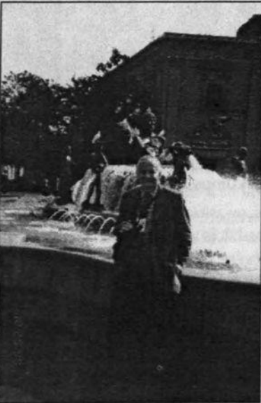
LU rektors Juris Zaķis Valensijā

Neliela atkāpe: LU radās 1919. gadā un joprojām ir pirmā klasiskā tipa universitāte, kur runā latviešu valodā. Vai tas ir labi vai slikti? Vai universitātem vajadzētu būt tik nacionālām?