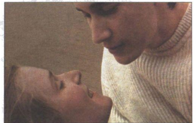
"La vie rêvée des anges"

Tā nu esam tikuši pie kinostāsta par divu meiteņu dzīvi starp sapņiem un īstenību.