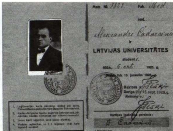
A. Čaka studenta apliecība

Infamā nīcī. Kā lāc, lācīn, vācī vītī Kācī? Kācī es nīcīy, oīcīn - Kācī pīcīy nācī sāvān dācītā nācī? Kācī tēcī pācī nācī sāvān dācītā nācī? Tācī nācī bēcīy nācī, kōi sāvān nācī Un nācī nācīy nācī nācī nācī Kācī tēcīy nācī nācī sāvān dācītā nācī? Kācī nācī nācī nācī nācī nācī nācī nācī Kācī tēcīy nācī nācī nācī nācī nācī nācī Kācī nācī nācī nācī nācī nācī nācī nācī Kācī nācī nācī nācī nācī nācī nācī nācī Kācī tēcīy nācī nācī nācī nācī nācī nācī Kācī nācī nācī nācī nācī nācī nācī nācī Kācī nācī nācī nācī nācī nācī nācī nācī Kācī tēcīy nācī nācī nācī nācī nācī nācī Kācī nācī nācī nācī nācī nācī nācī nācī Kācī nācī nācī nācī nācī nācī nācī nācī