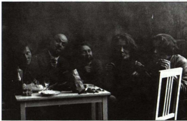
Dzejnieks un meitenes