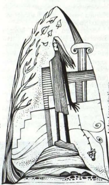
Andros Loses zīmējums

Сердце, словно треснутый бокал, Режет кисть души собою в кровь; И зачем-то свитки лживых слов Памяти сундук в себе собрал. Эти память, сердце и душа О пожаре молят каждый миг, Чтоб огонь стихией их настиг, Всё собой разрушил и смешал. Пусть сгорает прежняя печаль, Как бездарных рукописей бред; Как сжигает листья в октябре Желтизною осени свеча. Очищает пламя, как гроза, Что уходит, сея тишину, Смыто всё, и больше не вернуть Ни надежд, ни горечи назад. И судьба, как белый лист, лежит На ладони вечности немой, К ней летят причудливой пылью Умиротворенья миражи.