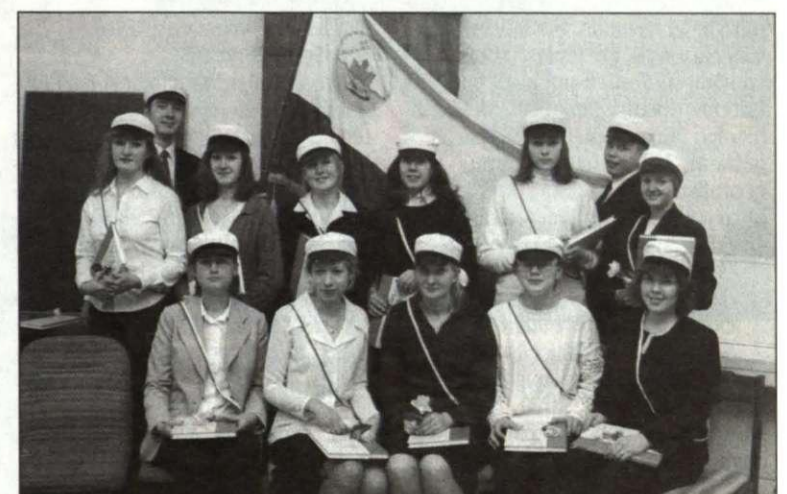
Pirmie "Dziesmuvaras" piltiesīgie biedri - savieši