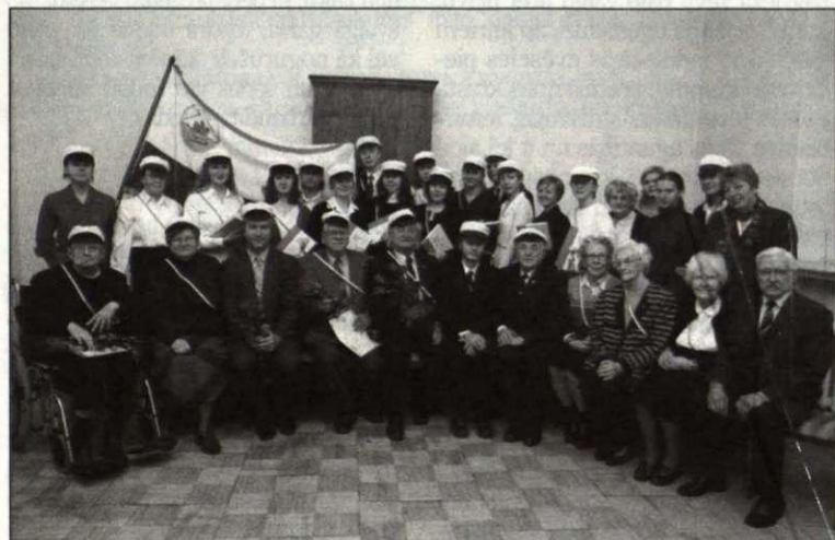
Dziesmuvarieši kopā ar Godabiedriem un viesiem