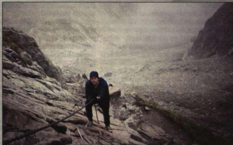
Raksta autors, kalnā kāpjot