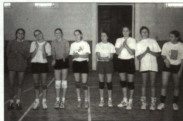
LU kausa izcīņas uzvarētājas - Ekonomikas un vadības fakultātes volejbolistes

Pedagoģijas un psiholoģijas fakultātes lektors