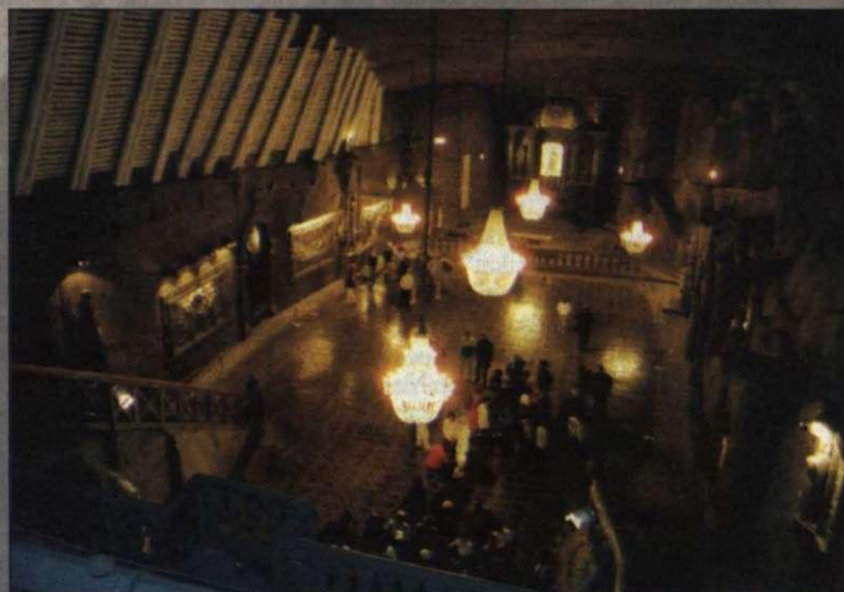
Unikāla kalnraču baznīca, kas atrodas vairāk nekā 100m dziļumā