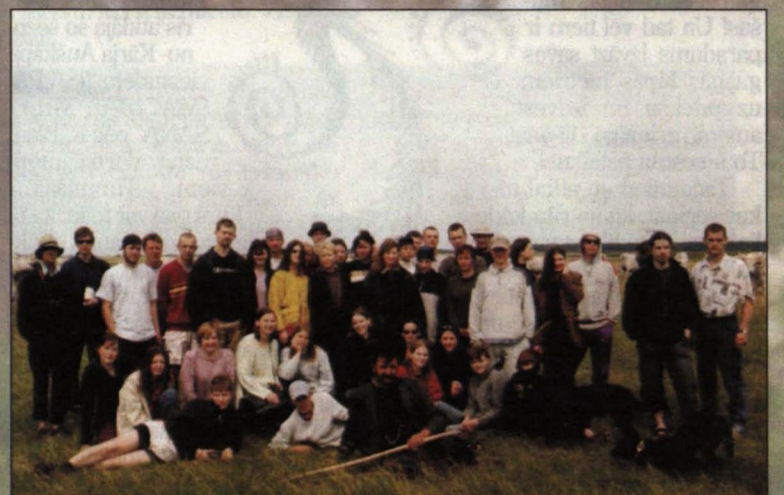
Ģeogrāfi, kas devās praksē pa Eiropu