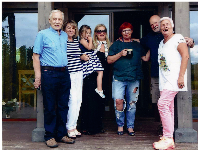
Ciemos pie kinorežisores Dzintras Gekas un komponista Pētera Vaska Amatciemā