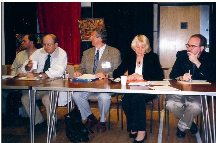
Fenomenologu kongresā Oksfordā 1998. gadā