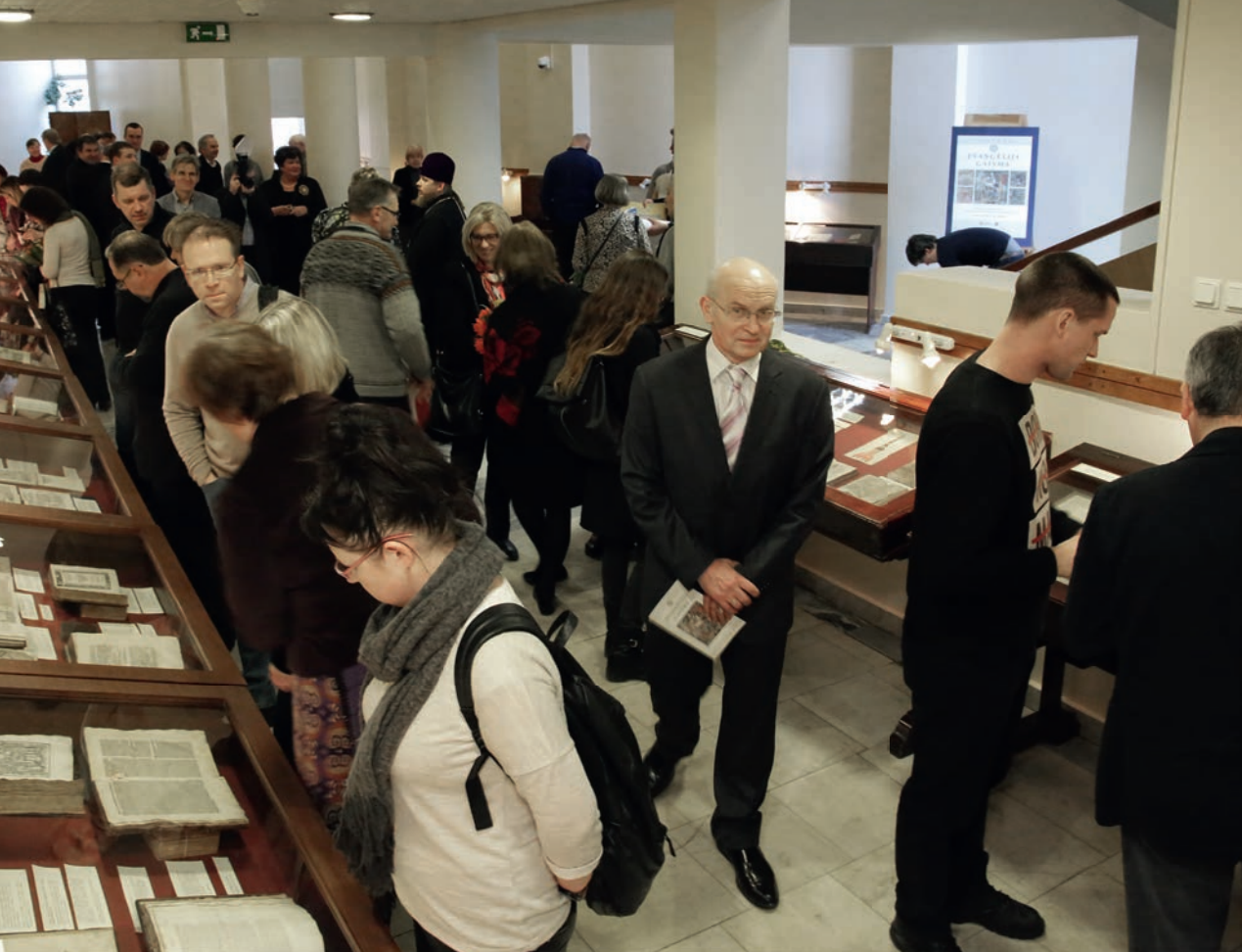
Izstādes "Evangēlija gaisma: Reformācija 16. gadsimta pirmavotos no Latvijas Universitātes Akadēmiskās bibliotēkas krājuma" atklāšana. 2017. gada 10. marts