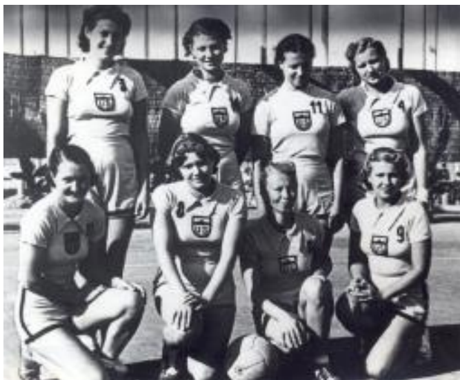
US sieviešu basketbola komanda. Ričioni (Itālija), 1939. gads.