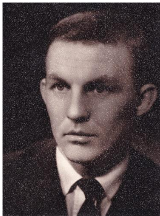
Valdis Muižnieks. 20. gs. 60. gadi.

1966. gadā LVU sieviešu un vīriešu komandas izcīna 1. vietu Latvijas PSR Studentu VI spartakiādē. Viens no redzamākajiem tolaik ir Valdis Muižnieks (1935-2013), LVU Juridiskās fakultātes students, 1956., 1960. un 1964. g. olimpisko spēļu vicečempions PSRS izlases sastāvā, 1957., 1959. un 1961. g. Eiropas čempions PSRS izlases sastāvā. 1965. gadā, studiju gados piedaloties LVU čempionātā, izcīna 1. vietu 1966. gada Latvijas PSRS studentu VI spartakiādē un palīdz komandai citās nozīmīgās sacīkstēs.