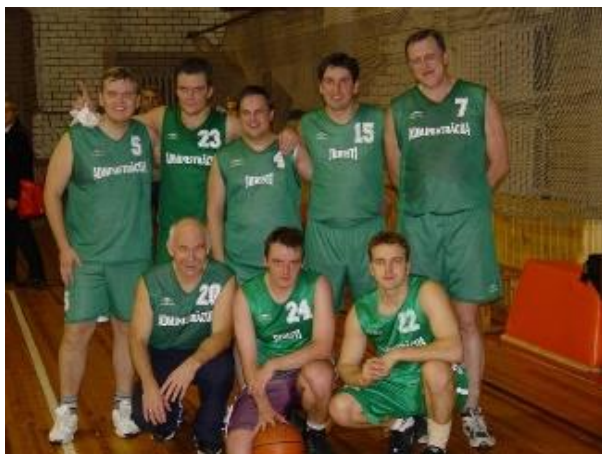
LU mācībspēku basketbola komanda LU ceļojošā kausa izcīņas posmā. 21. gs. pirmās desmitgades vidus.