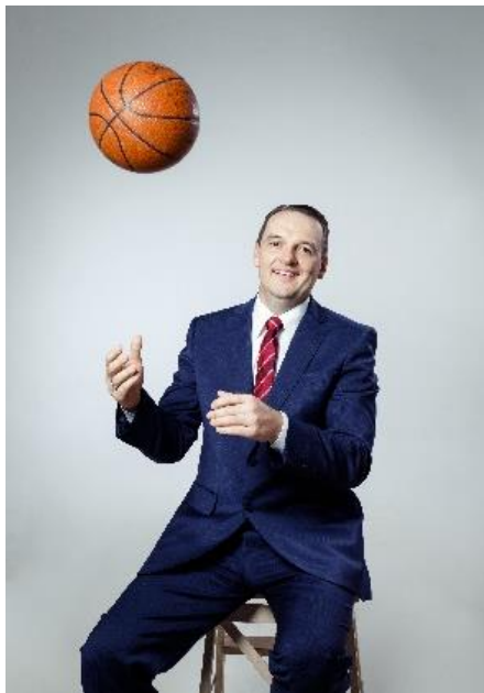
Latvijas sieviešu basketbola izlases galvenais treneris Mārtiņš Zībarts. Rīga, 2018.gads.