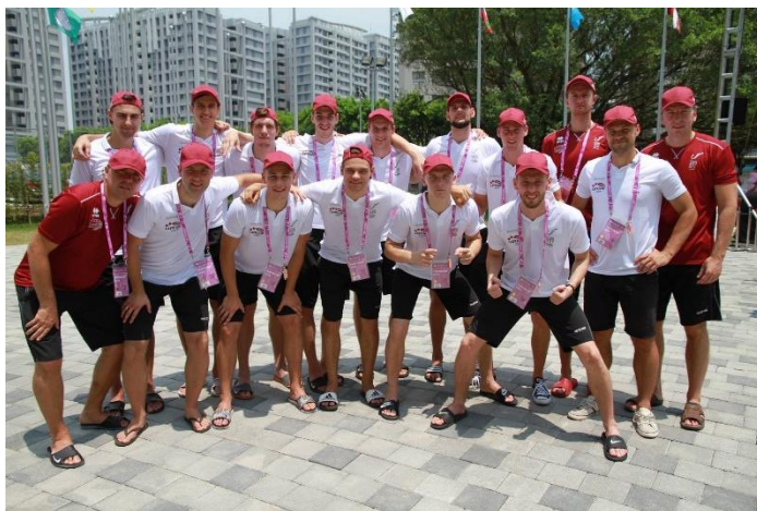
Latvijas studentu basketbola komanda XXIX Pasaules Universiādē Taipejā (Taivānā), 2017. gads.

2017. gadā LU vīriešu komanda izcīnā 1. vietu SELL spēlēs.