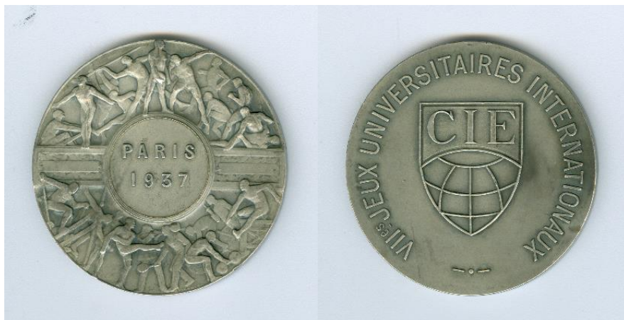
Piemīņas zīme no VII Studentu pasaules meistarsacīkstēm. Parīze, 1937. gads.

1937. gadā US vīriešu komanda iegūst 1. vietu, sieviešu komanda – 2. vietu VII Studentu pasaules meistarsacīkstēs Parīzē (Francijā).