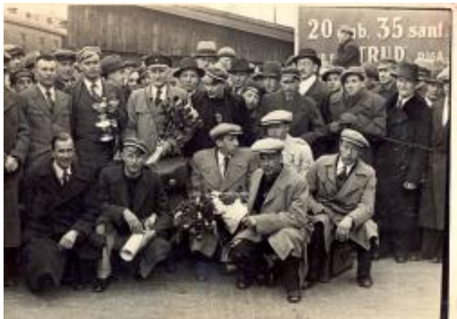
US basketbolisti Latvijas basketbola izlases sastāvā, atgriežoties no I Eiropas basketbola meistarsacīkstēm Ženēvā ar izcīnīto kausu. Rīga, 1935. gads.

Par šo nozīmīgo notikumu Latvijas basketbola attīstībā 2013. gadā uzņemta mākslas filma „Sapņu komanda 1935” (rež. Aigars Grauba), ieskatu par to var gūt: https://www.youtube.com/watch?v=z92TX-y7kfk