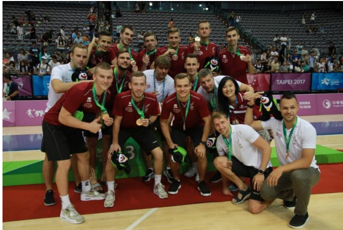
LU basketbolisti un treneri Latvijas studentu basketbola komandas sastāvā pēc izcīnītās bronzas medaļas saņemšanas XXIX Pasaules Universiādē Taipejā (Taivānā), 2017. gads.