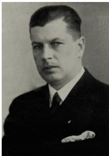
Roberts Plūme. Rīga, 1939. gads.

Akadēmisko sporta biedrību, vēlāk – “Universitātes Sports”, kā arī darbojās kā Latvijas Basketbola Savienības priekšsēdētājs (1925-1935).