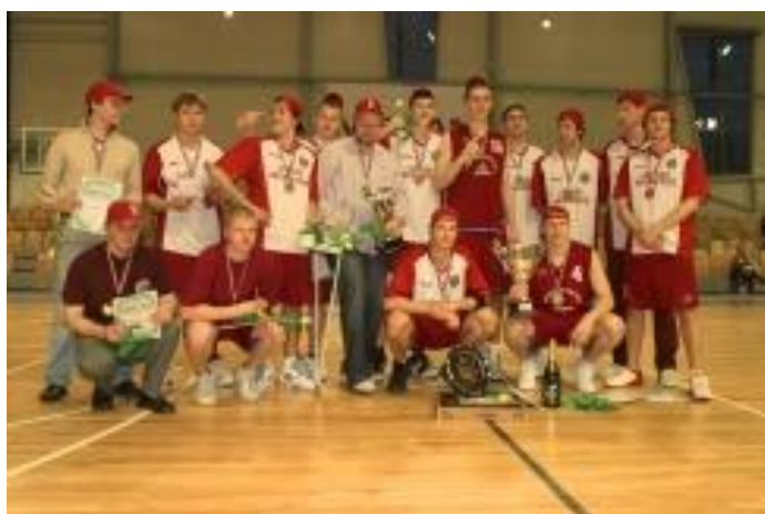
Vīriešu komanda pēc uzvaras SEB Studentu līgā. Rīga, 2006.

2006. gadā LU vīriešu komanda izcīna 1. vietu SEB Studentu basketbola līgā.