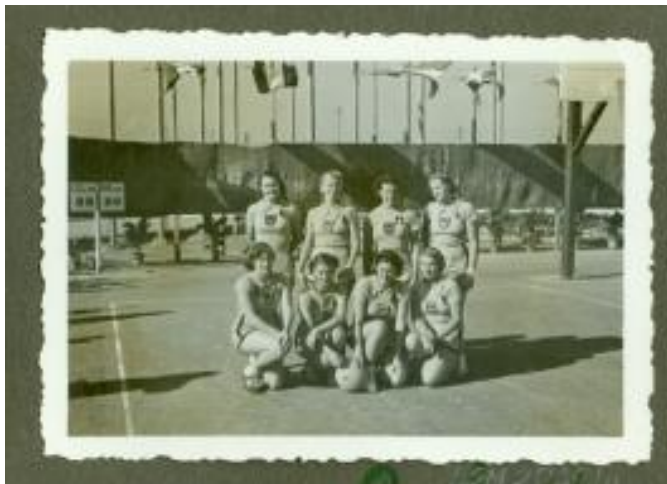
US sieviešu basketbola komanda. Ričioni (Itālija), 1939. gads.