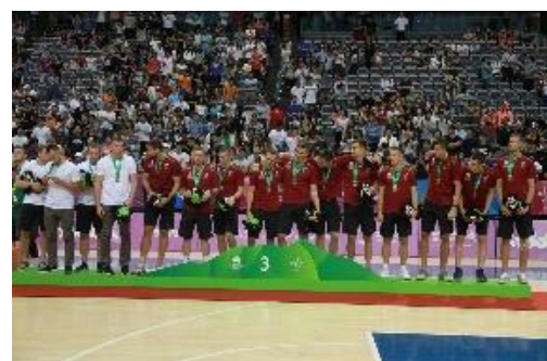
Saņemot bronzas medaļas XXIX Pasaules Universiādē Taipejā (Taivānā), 2017. gads.