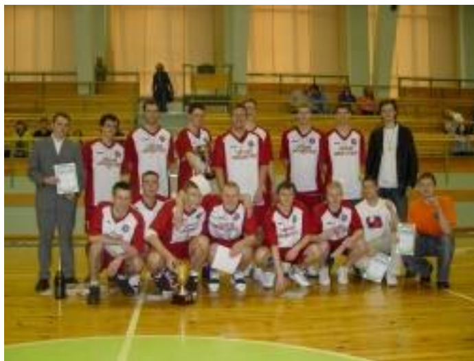
Vīriešu komanda pēc uzvaras Latvijas Universiādē. Rīga, 2004.

2004. gadā LU sieviešu un vīriešu komandas iegūst 1. vietu Latvijas Universiādē.