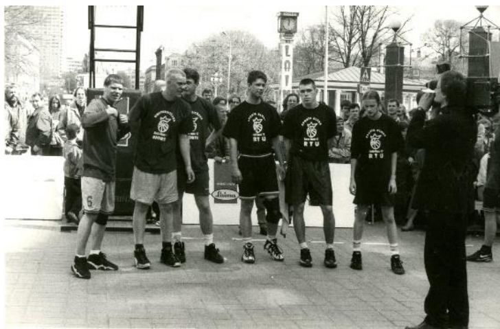
“Karaļu mačs” ceļojošā kausa izspēle. Rīga, 1995.-1998. gads.

Laika posmā no 1995. līdz 1998. gadam, pastāvot ceļojošā kausa „Karaļu mačs” izcīnām starp LU un RTU komandām, LU basketbola komanda uzvar visos notikušajos mačos.