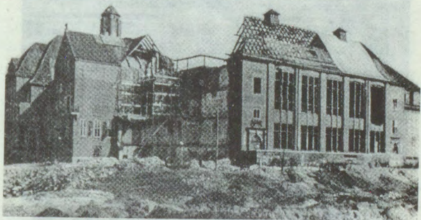
1. Hamburga 1945.gadā. Vēstures muzeja ēka.