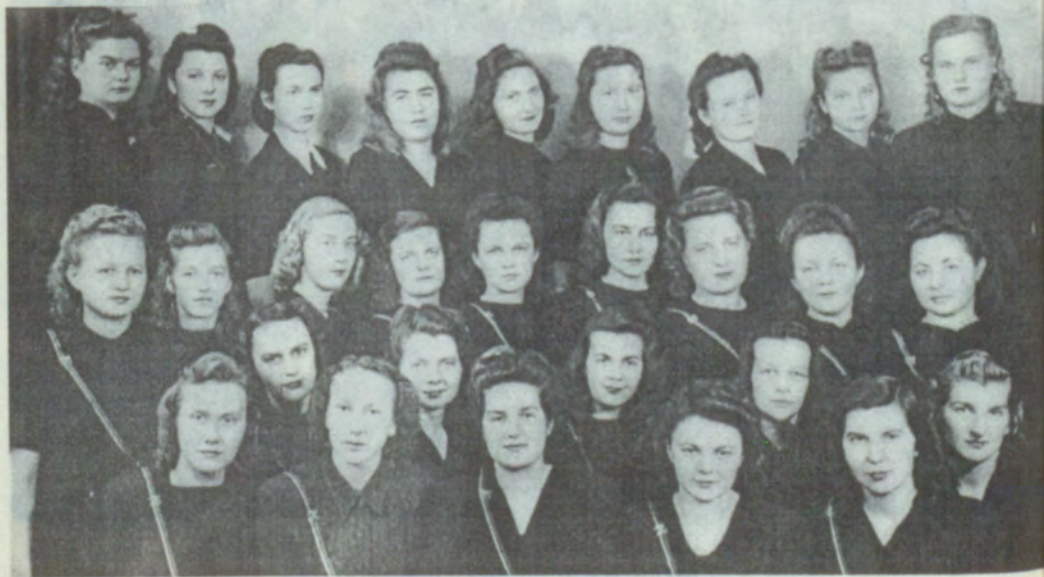
26. Studenšu korporācijas Zinta saime, 1948.g.