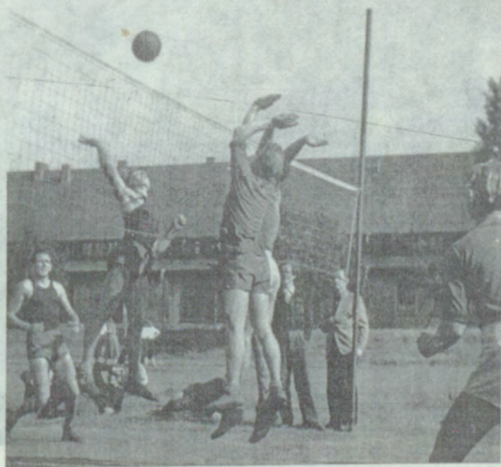
20. Volejbola sacensības Pinebergā, 1949.g.