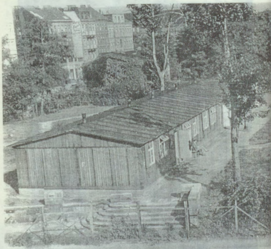
6. "Zoo" nometne. Studentu baraka, 1946.g.