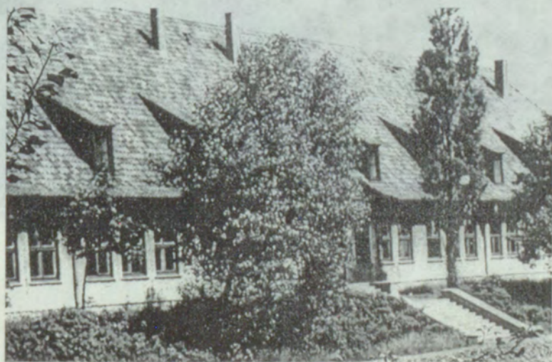
5. Aula Magna.