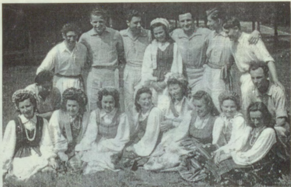
21. Lietuvių studentų tautos deju grupą, 1948.g.