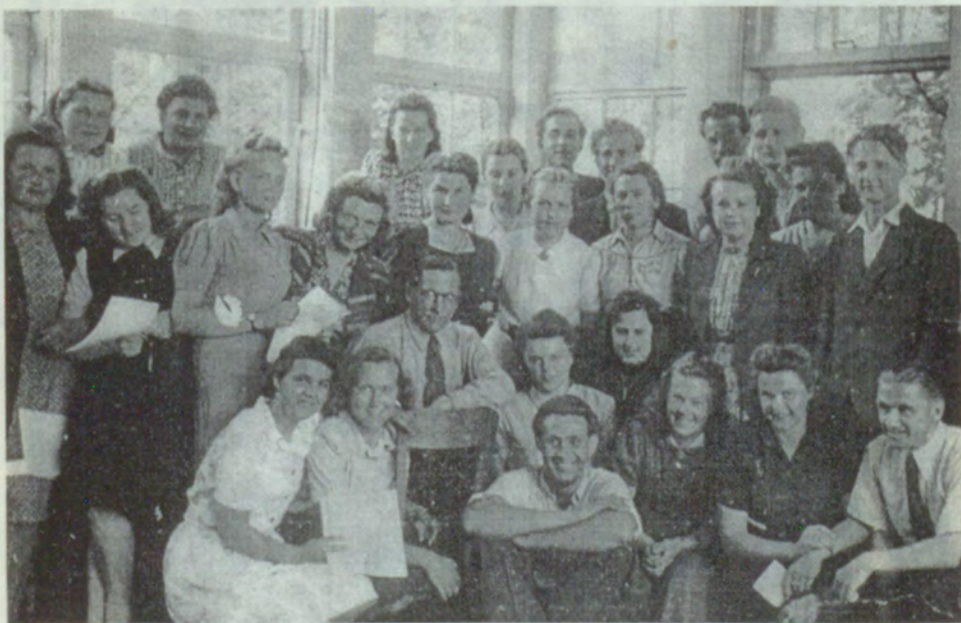
22. BU koris.