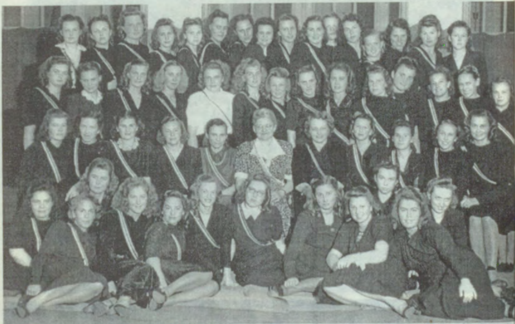
25. Studenšu korporācijas Spīdola saime, 1948.g.