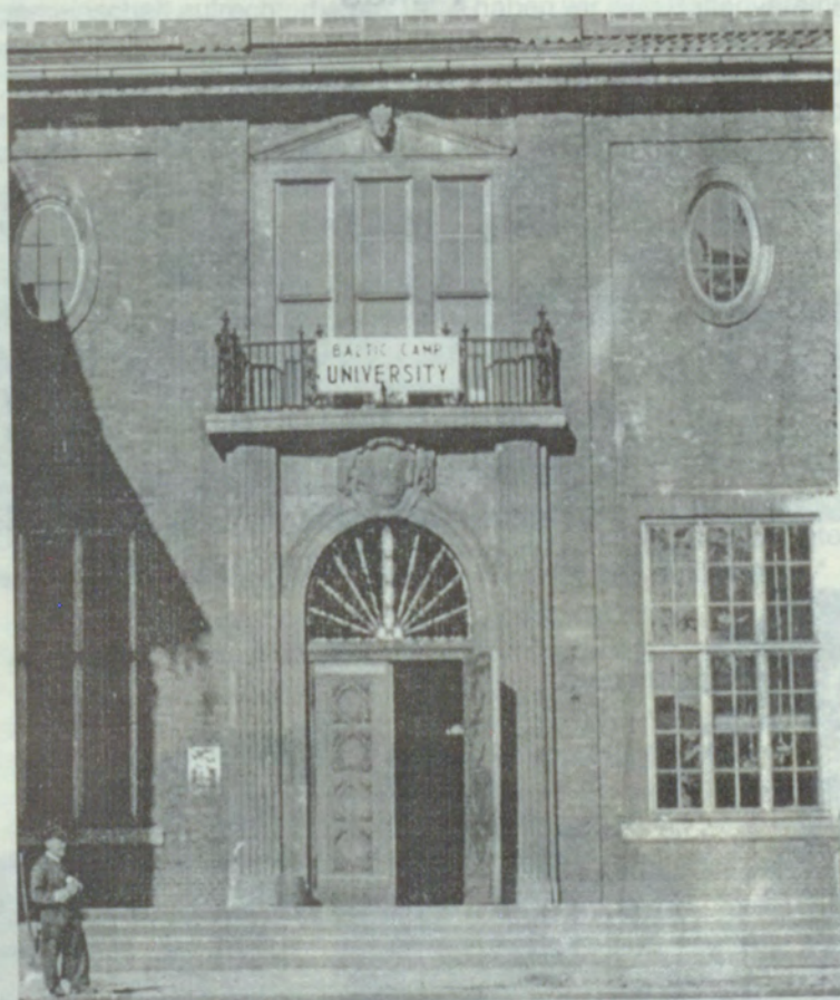
3. leeja Vēstures muzejā, 1949.g.