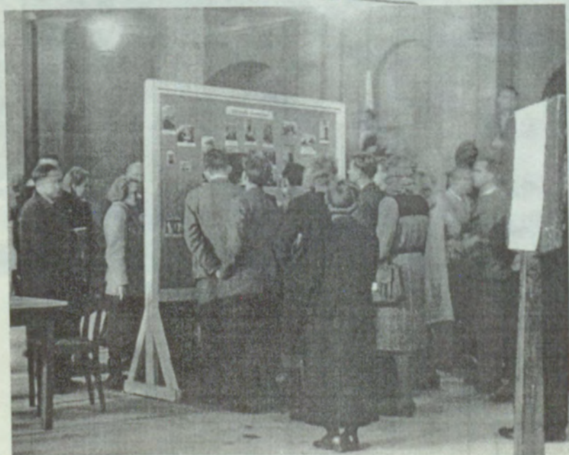
9. Baltijas tautu kultūrvēsturisko sasniegumu izstāde, veltīta BU atklāšanai, 1946.g. 25.maijs.