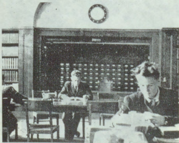
15. BU studenti bibliotekā.