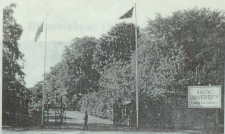
4. Ieeja "Ciemā ar zelta karogu", 1946.g.