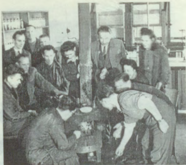
17. Ķīmijas fakultātes studenti uz ogļu krāsniņas iztvaicē doto analīzes materiālu.