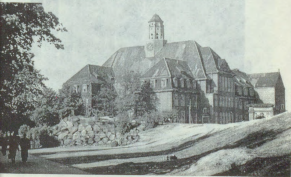
2. Hamburgas vēstures muzeja ēka 1947.gadā.