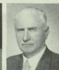
Doc. N. Transehe