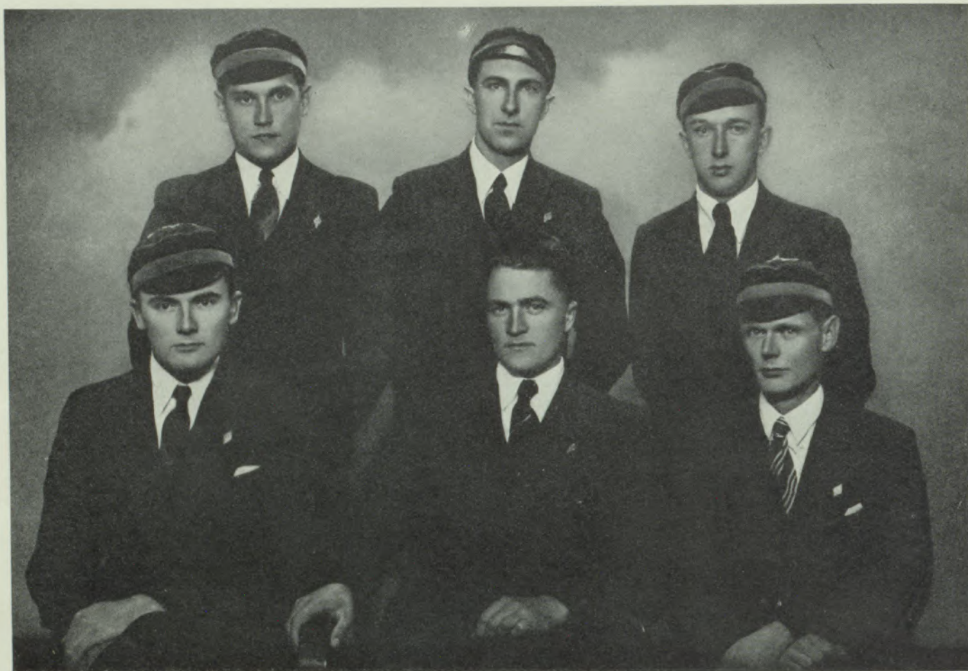
Šalkones padomes priekšsēdētājs un valde 15 gadu jubilejā.

1936. gadā Šalkone lūdza valdības iestādes anulēt lēmumu par Poguļankas pārdēvēšanu Šalkones vārdā. Šo lūgumu Valsts Prezidenta Dr. Kārļa Ulmaņa atbalsta dēļ arī ievēroja, un Poguļanka izraudzītā Šalkones vārda vietā dabūja citu.