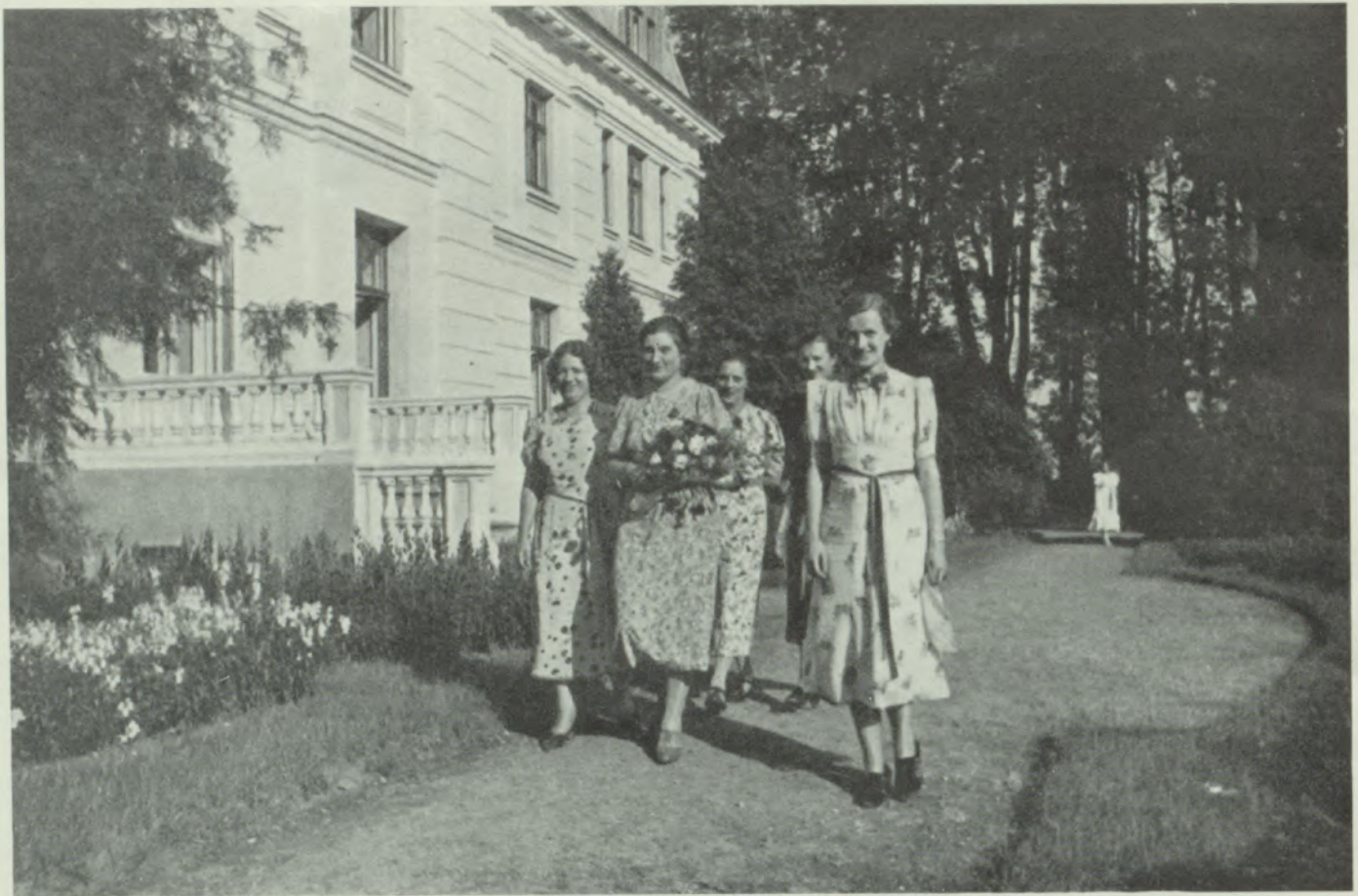
Šalkones dāmu komitejas valde 1938. g.