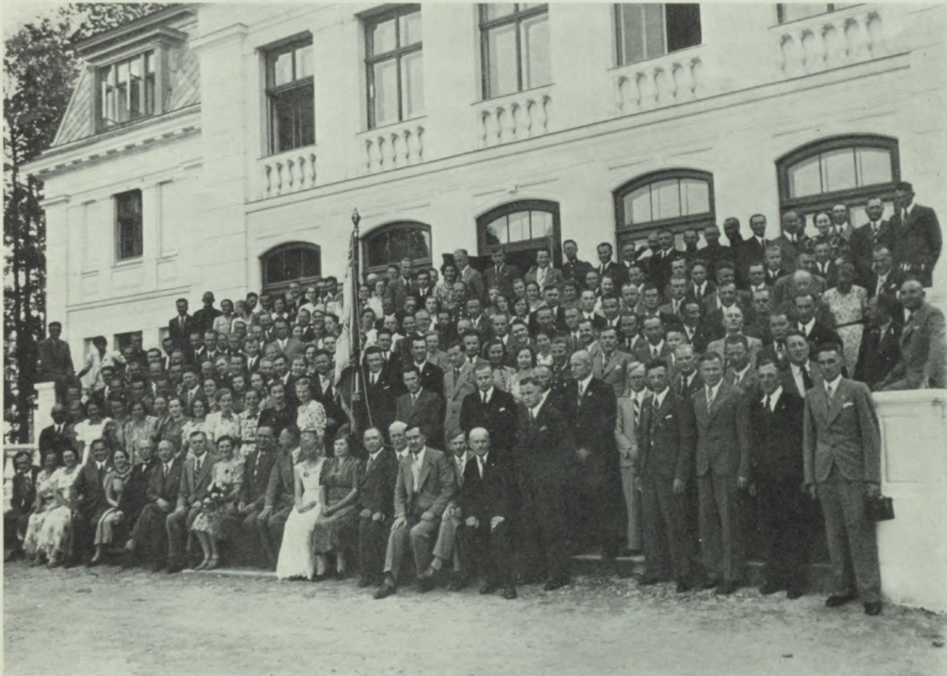
Šalkones 15 gadu jubilejas dalībnieki.