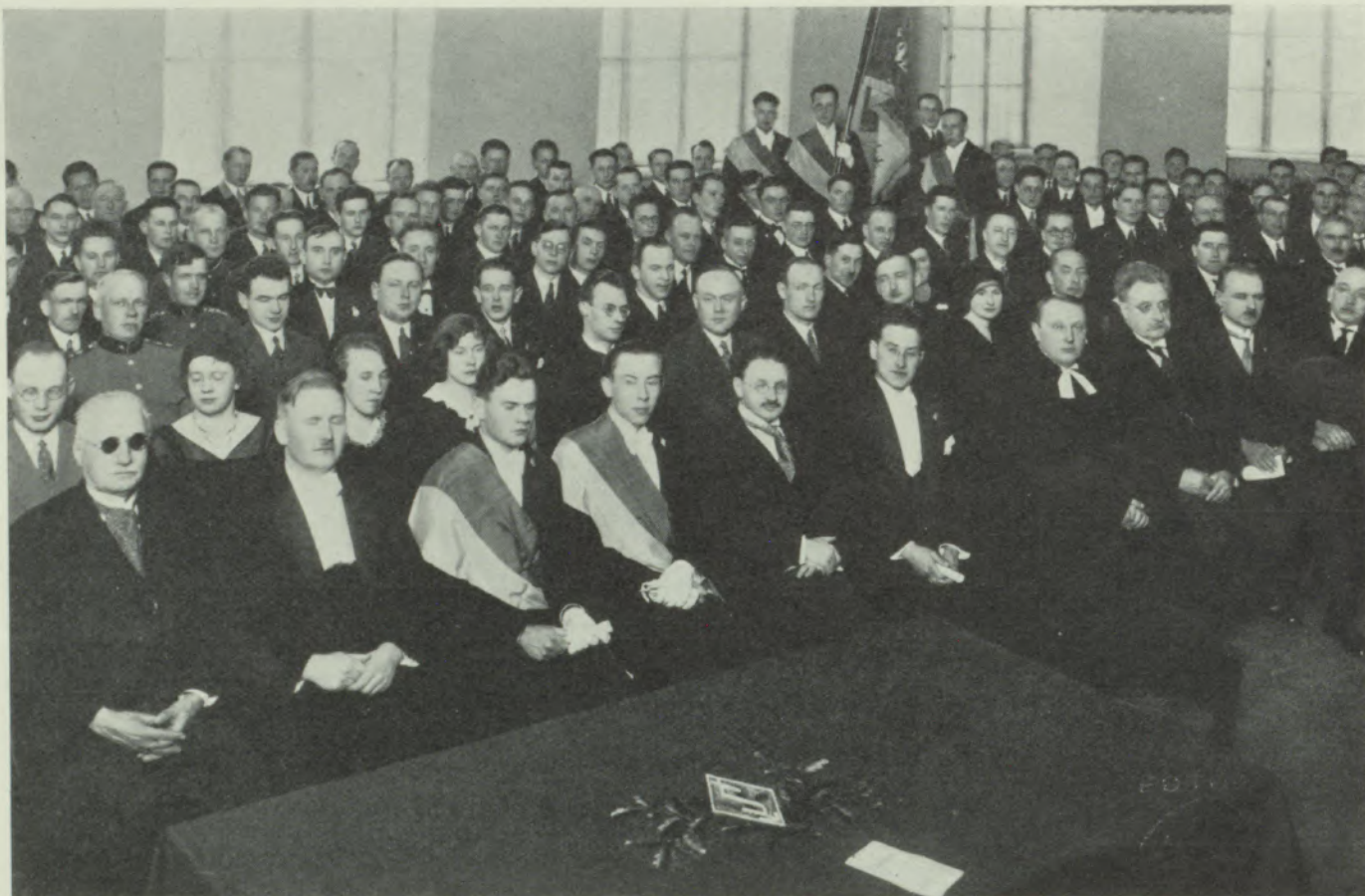
Karoga iesvētišanas akts 1931. g. 3. maijā.