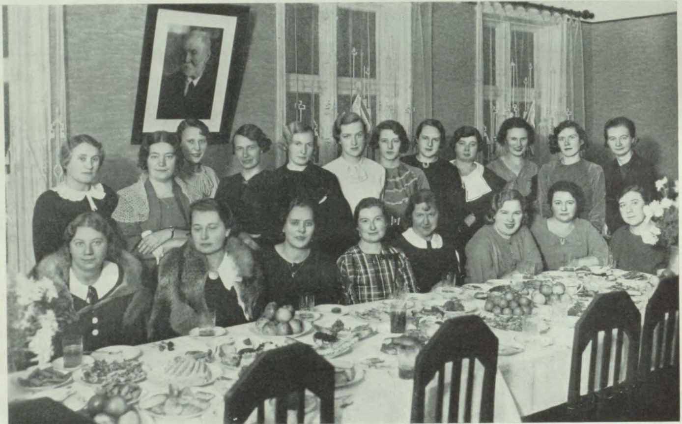
Šalkones dāmu komitejas groziņu vakars.