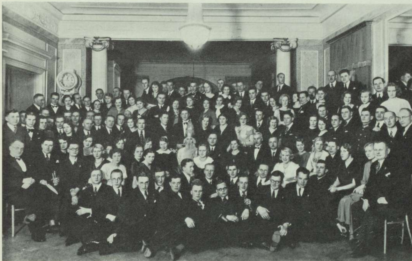
Šalkones eglītes vakars 1934. g. 9. decembrī.

Tāpēc Šalkones oficiālo nosaukumu „Latvijas universitātes studējošo mežkopju biedrība Šalkone” mainīja par „Latvijas universitātes studentu biedrība Šalkone”, tomēr Šalkones iekšējais gars palika tāds pats, kādu to bija vēlējušies dibinātāji. Pēc tam galvas segu līdz ar jaunajiem statūtiem apstiprināja universitātes padome. Galvas segas projekta autors ir com. A. Baškers.