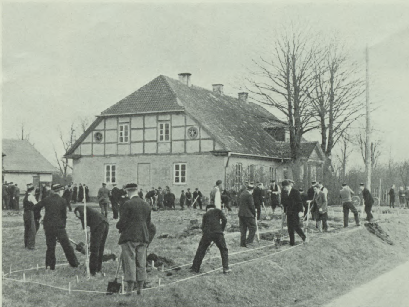
Šalkones meža dienas Valsts un Ministru Prezidenta Dr. Kārļa Ulmaņa pirmā skolā Bērzmuižā.

Runājot par Šalkones ārējām nozīmēm, jāsaka, ka, lai gan jau sākumā Šalkones statutos bija paredzētas ārējas nozīmes, to ieviešanu atlika uz vēlāku laiku, jo sākumā