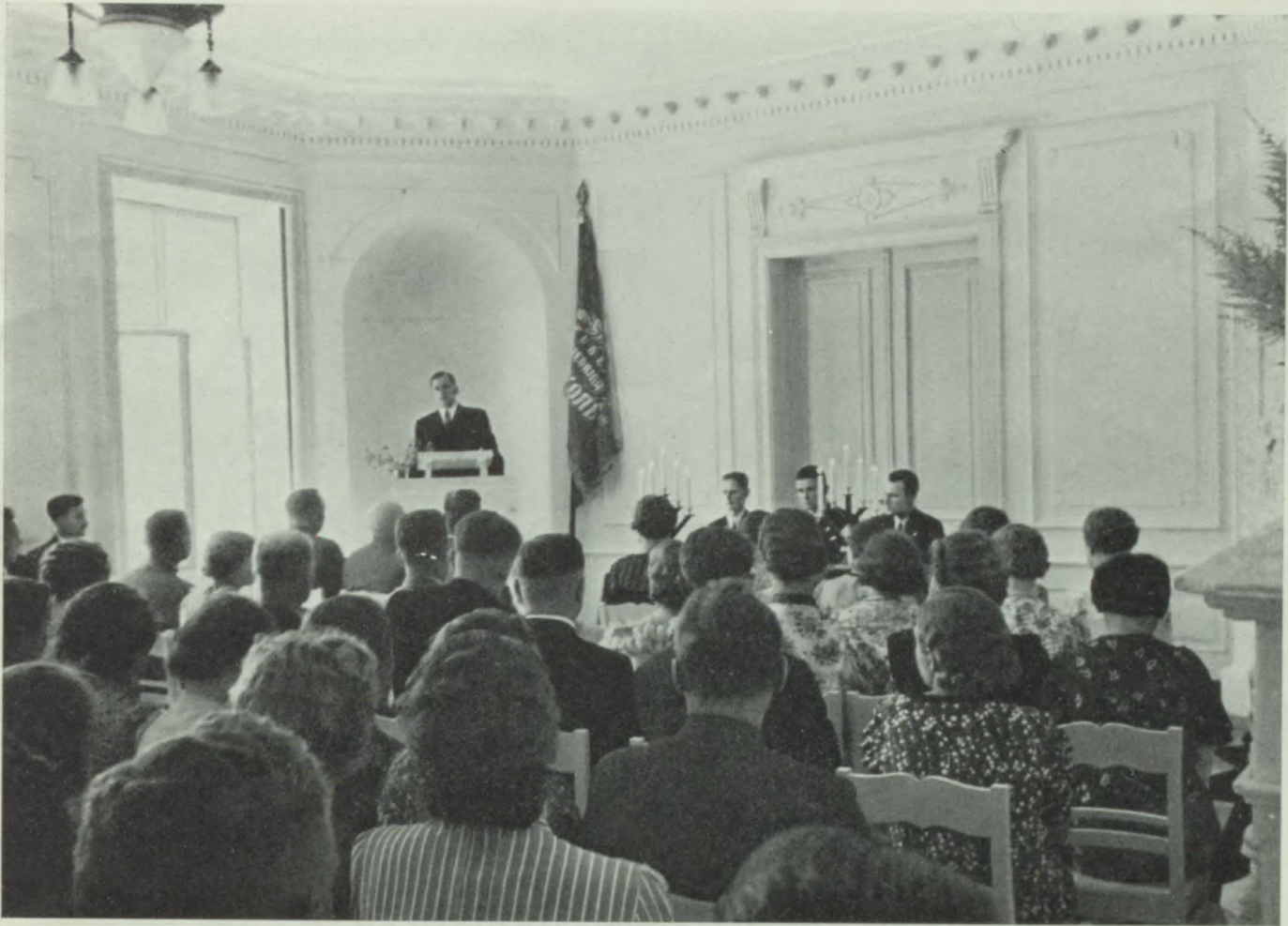
Šalkones 15 gadu atceres akts.

1926. gadā pieņemta medību taures pūšanas apmācības instrukcija un uzsākta orga-