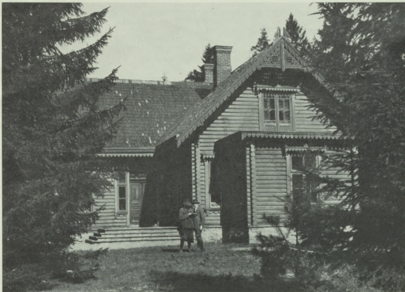
Šalkones medību māja Dzelzāmurā.

„Es apņemos pēc labākās apziņas izpildīt no biedrības man uzliktos pienākumus, augsti turēt studenta mežkopja godu, uzturēt vissirsnīgākās attiecības ar organizācijas biedriem kā studiju laikā, tā arī vēlākā dzīvē, darīt visu man iespējamo mūsu mežu bagātību vairošanai.”