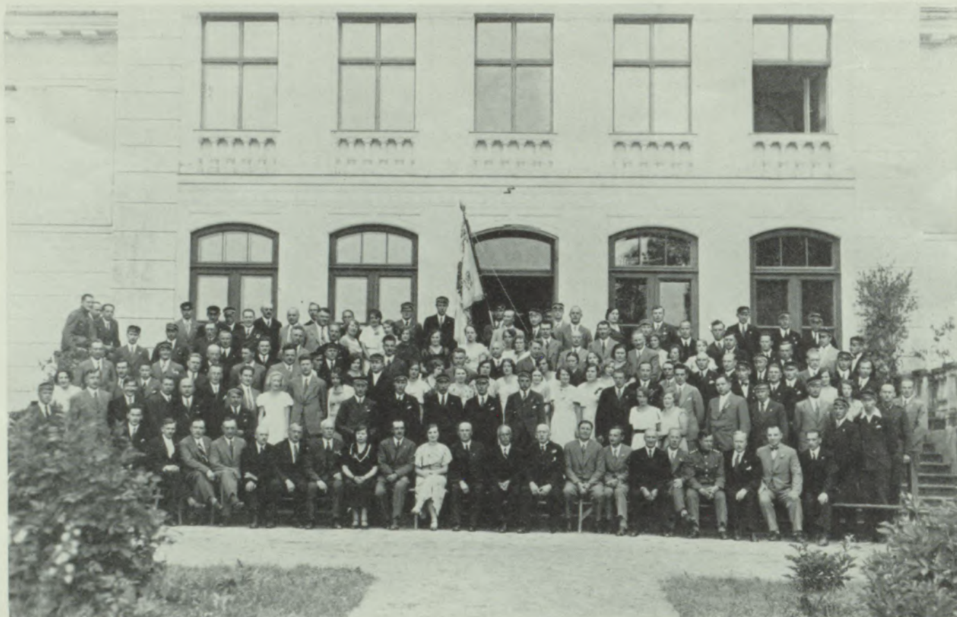
Šalkones 10 gadu jubilejas dalībnieki.

Pirmos 5 gados biedrībai bija daudz darba ar iekšējās dzīves veidošanu, dažādu instrukciju un noteikumu izstrādāšanu un pieņemšanu. Izstrādā medību un sporta komisijas, zinātniskās komisijas, dziedāšanas un medību taures pūšanas apmācības instruk-