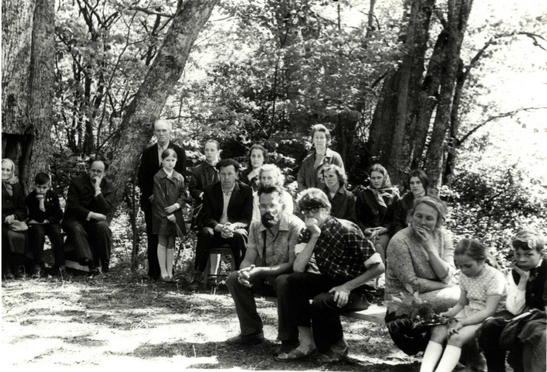
Jāņa Ilstera piemiņas staba atklāšanas viesi

Ir izveidots Jāņa Ilstera fonds , kas cieši sadarbojas ar Latvijas Dabas muzeju, uztur sakarus ar lauksaimniecības un medicīnas studentiem un skolu jaunatni, veicinot interesi par bioloģiju, botāniku un zooloģiju kā Latvijas kultūras un latviskās dzīvesziņas sastāvdaļu (Rozeniece, 2001).