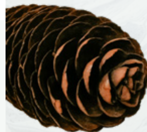
Picea morinda čiekuri