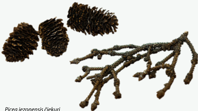
Picea jezonensis čiekuri

LU Muzeja Botānikas un mikoloģijas kolekciju herbārijā Herbarium Latvicum (RIG II) glabājas egļu herbāriji: 12 Picea abies un 1 Picea glauca .