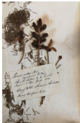
Picea glauca syn. Pinus alba