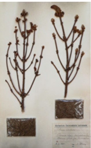
Picea abies syn. P. excelsa

LU Muzeja Botānikas un mikoloģijas kolekciju herbārijā Herbarium Latvicum (RIG II) glabājas egļu herbāriji: 12 Picea abies un 1 Picea glauca .