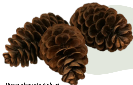
Picea obovate čiekuri