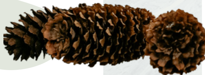
Picea abies čiekuri

LU Muzeja Botānikas un mikoloģijas kolekcijās ekspozīcijā "Čiekuri" apskatāmi 12 egļu sugu čiekuri no visas pasaules.