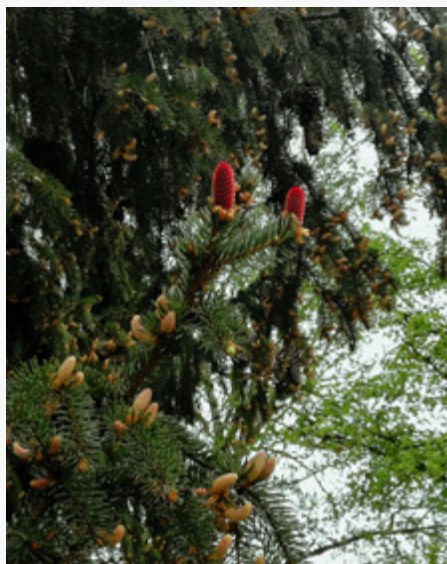
Picea abies Kronvalda parkā Rīgā

Eglei ir sievišķie un vīrišķie čiekuri , kas atšķiras pēc izskata un funkcijas. Vīrišķie aug augstāk, lai vējš labāk apputeksnētu sievišķos čiekurus. Putekšņu ļoti daudz, tiem katram 2 lidpūslīši, un vējš tos aiznes kilometriem tālu. Zied maijā. Rudenī nogatavojas cilindrvēda, nokareni čiekuri, kam uz katras sēklzvēņas (čiekurzvēņas) ir 2 spārnainas sēklas (spārns liels, sēklu ietver karotes veidā), kas izbirst nākamā gada aprīlī, maijā, tās izplata vējš.