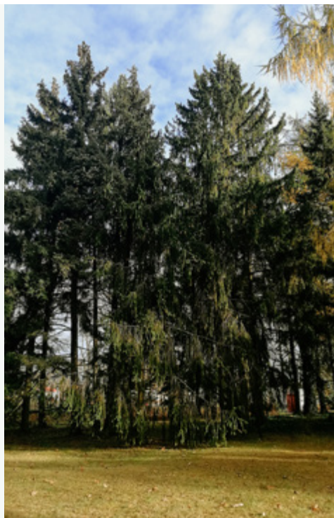
Picea abies LU Botāniskajā dāzā

Parastā egle ir pirmā (>25 m) vai otrā (15 – 25 m) lieluma koks, bet var izaugt līdz 40 m augstumā un vairāk kā 3 m apkārtmērā. Tās mūža ilgums ir ap 300 gadu, bet skujuas mainās ik pēc 5 – 7 gadiem, pilsētā biežāk.