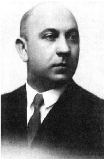
K. Ābele 1930. gados. https://upload.wikimedia.org/wikipedia/lv/4/48/K%C4%81rlis_%C4%80bele.jpg

22. augustā atzīmējam botāniķa un literāta, Lāčplēša kara ordeņa kavaliera Kārļa Ābeles (1896 - 1961) 125. jubileju. Gan literatūrā, gan botānikā viņa galvenā interese bija nāves un dzīvības un tās turpināšanas tēma. Literatūrā K. Ābele ir izcēlies kā balāžu meistars, bet botānikā – augu anatomijas, citoloģijas, kas ir mācība par šūnu un augu embrioloģiju, aizsācējs Latvijā.