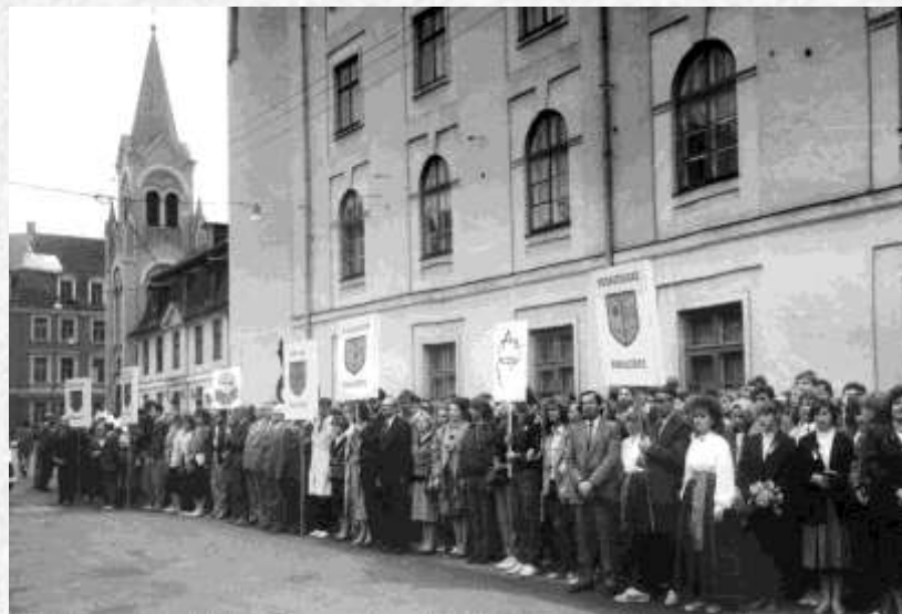
Attēlos: Latvijas Universitātes fakultātes studentu gājiņā Aristoteļa svētkos.