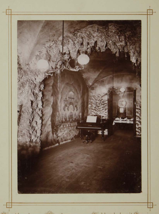
Durchbruch vom Meerbusen zum Soekkwabek mit Sirenium.