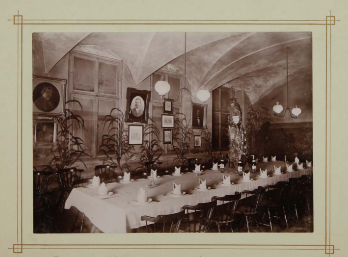
Meerbusen (Atzungsraum) vom Durchbruch aus gesehen.