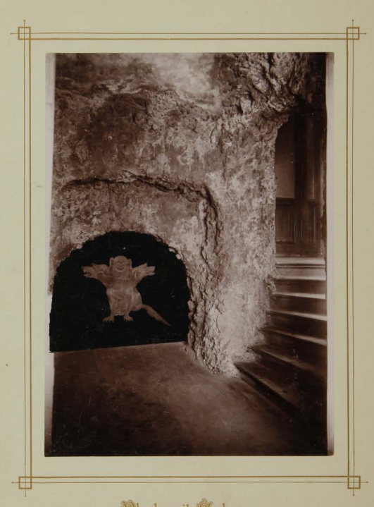
Phede mit Gerberus: