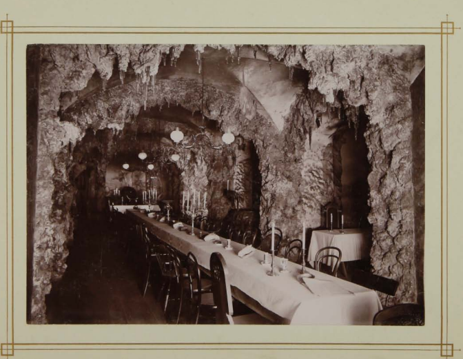
Soekkwabek vom Durchbruch aus gesehen.