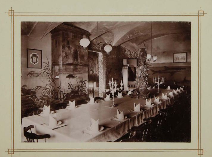
Meerbusen (Atzungsraum) zum Durchbruch geschen.