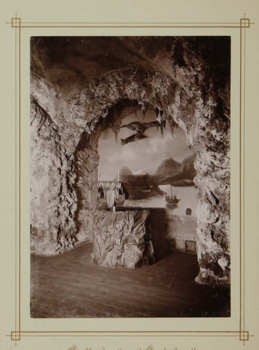
Nordlandgrotte mit Qualschputt.