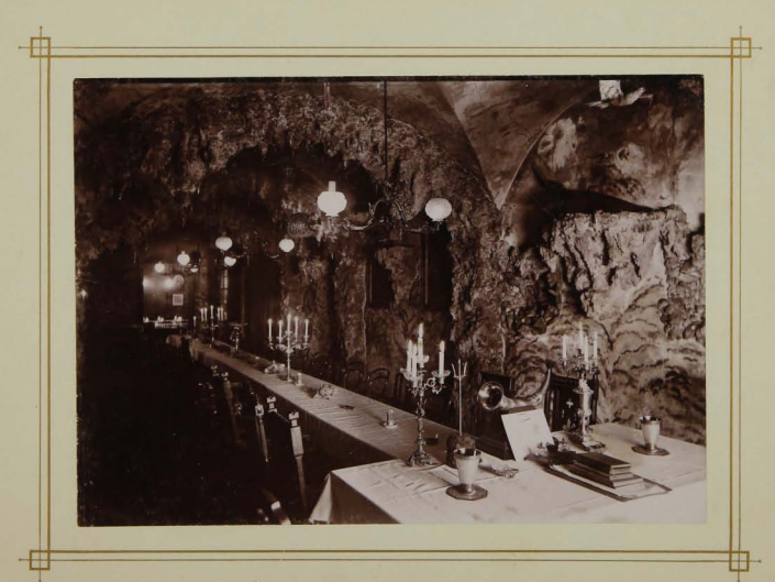
Soekkwäbek vom Hochriff aus gesehen.