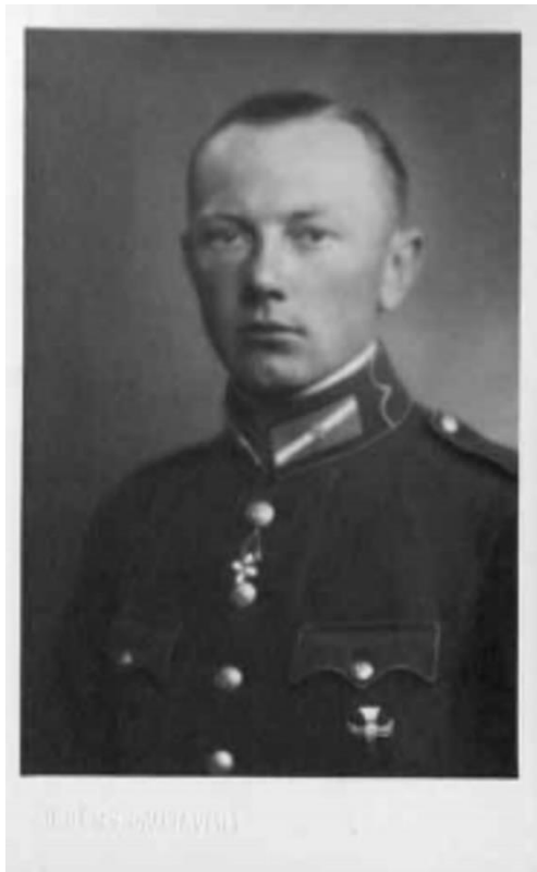
Pēteris Čevers pēc Latvijas Kara skolas absolvēšanas 1937. gadā.

Pēteris Čevers ir Latvijas sabiedrībā un Latvijas vēsturnieku vidū pazīstams kā viens no Latvijas Nacionālo partizānu kara (1944-1956) dalībniekiem, kurš vadīja t.s. Čevera partizānu grupu Kurzemē otrreizējās PSRS okupācijas sākumā pēc Otrā pasaules kara; pirms tam viņš dienējis Latvijas armijā, Sarkanajā armijā un Waffen SS latviešu leģionā. Līdz šim nav tikusi pievērsta uzmanība viņa gaitām Latvijas Universitātē (LU), kur uzsāka studijas jurisprudencē, līdz tās pameta un pārgāja uz militāro karjeru, iestājoties Latvijas Karaskolā, pabeidzot to un kļūstot par Latvijas armijas virsnieku. Zināms ir fakts, ka viņš bija latviešu studentu korporācijas Fraternitas Metropolitana biedrs, taču detalizētāk arī nekas nav zināms par viņa iesaisti studentu korporācijas dzīvē.