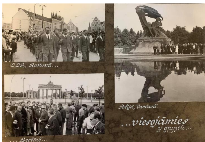
Fotogrāfijas no jau RPI kora uz Austrumvāciju 1971. gadā un Poliju 1969. gadā.

Daļa studentu pievienojas RPI korim. Albumā atrodamas fotogrāfijas no šī