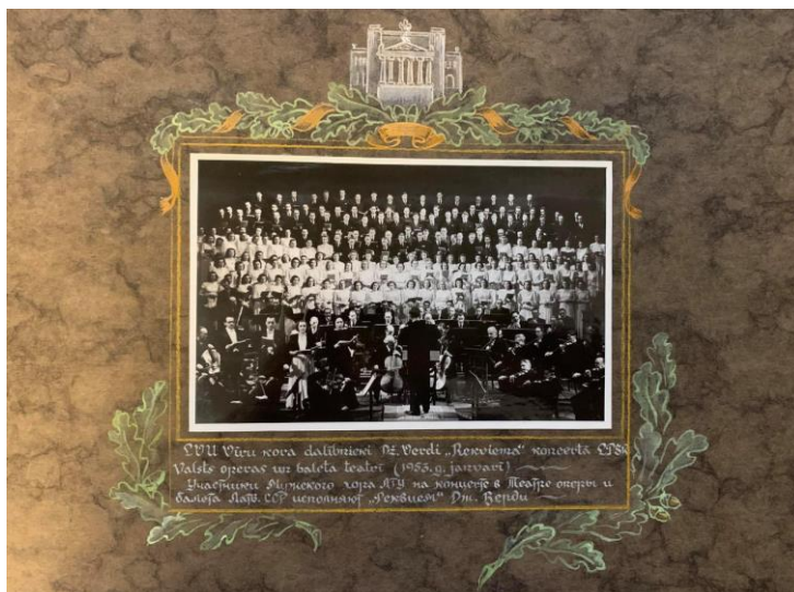
LVU Vīru kora dalībnieki Džuzepes Verdi operas “Rekviēms” koncertā 1953. gada janvārī.