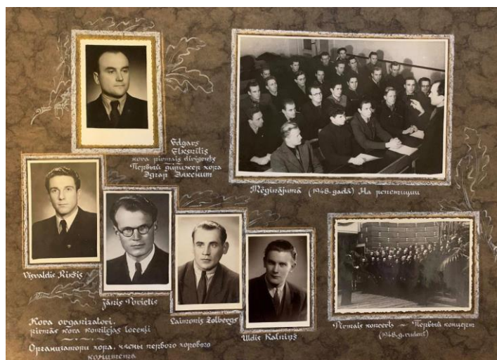
LVU Vīru kora organizatoru un pirmās kora komitejas dalībnieku fotogrāfijas; kora pirmo gaitu atspoguļojums mēģinājumā un pirmajā koncertā 1948. gadā.

Albumā ļoti plaši atainoti kora koncerti gan Universitātē, gan dažādās Latvijas pilsētās. Albumā kā pirmais atzīmēts un fotogrāfijā attēlots koncerts LVU Lielajā aulā 1948. gada rudenī, lai gan citos avotos minēts, ka pirmais koncerts noticis 1949. gada 26. februārī.