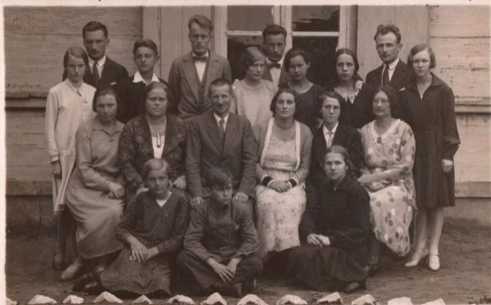
Rīgas Strazdumuižas skolā - 1933.g.