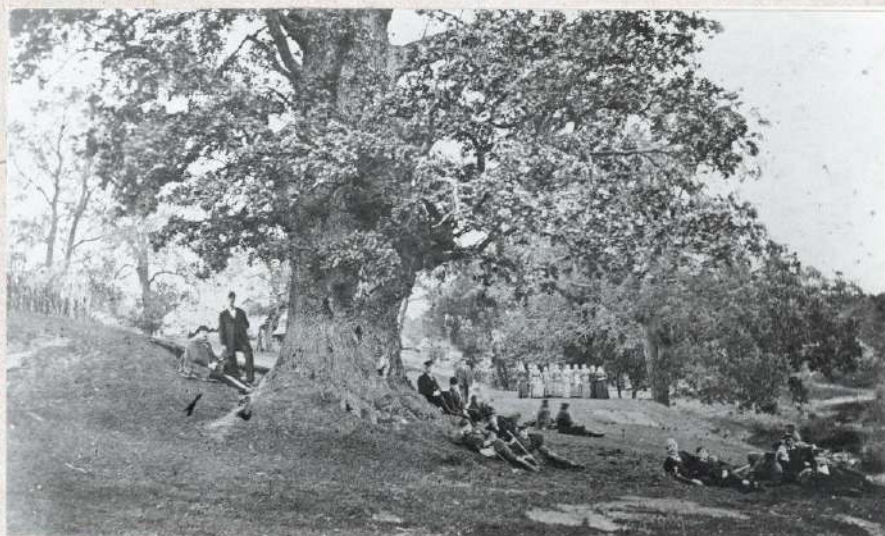
/ 8. foto /

Lancmanis ieteic mums pārbaudīt tos dzinuļus, kas spiež angļu fabrikantus Rīgas nomalē piemūrēt ozoliem dobumus.