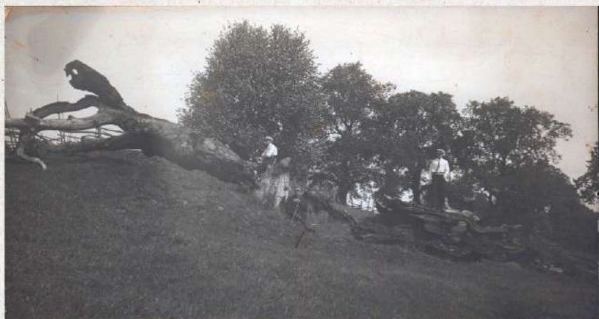
/ 9. foto /

Sīmanēnu svētais upurozols Valmieras tuvumā. Ozola apkārtmērs 8\frac{1}{2} m. Ar 2 apzīmēts dzejnieks Rieteklis. Upurozols nodedzināts 1920. gadā Vasaras svētkos. Sk. nākošo uzņēmumu.