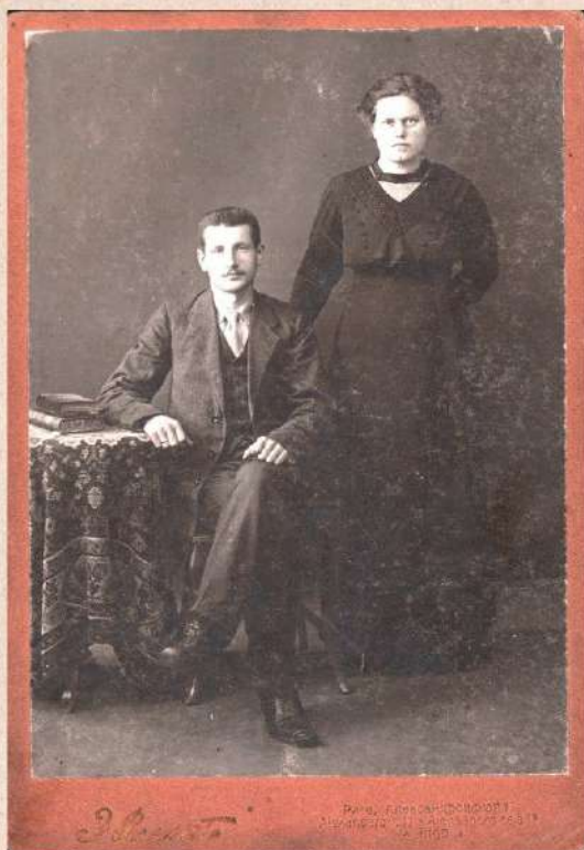
Lancmanis un dzīves biedre. Lejasciemā 1915.g.