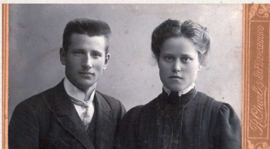
Lancmanis Pēterpilī 1917.g.

Apkārtnes mācība, aplūkodama parādības no v i s d a ž ā - d ā k i e m v i e d o k ļ i e m, jau ar to veicina skolēnu kri- tikas spējas, asina daudzpusīgu skatu. Skolēnu brīvā stāstīšana kritikas vingrināšanu padara par nepieciešamu. Nav reti gadīju- mi, kur skolēnu spilgtāki pieredzējumi un mājnietu ziņas modina īstus stāstīšanas "plūdus". Tur klausītāju kritiskas atziņas: "nav par stundas tematu", "varēja īsāk, tikai galveno teikt", la- bi atvieglo darba pavadīšanu ieturēšanu. Tas tomēr prasa lielu taktu, rūpīgu saudzību no skolotāju puses, lai neaizvainotu jutī- gos "referentus". Svarīgs brīdis no šī viedokļa ir pārrunu kop- savilkums. Pārrunās minēto faktu īsa atzīmēšana uz klasas tāpe- les, sistematizēšana, salīdzināšana, vērtīgākā izcelšana, jaunu, līdz tam svešu ieguvumu uzmeklēšana - ir vērtīgi etapi lietiskās kritikas spēju vingrināšanā. "