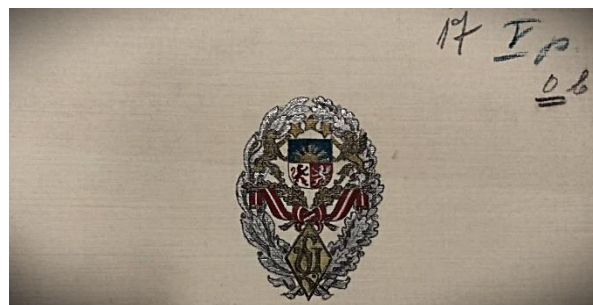
LU Akadēmiskās nozīmītes skice (5. paraugs), 1929. gadā.

1932./1933. ak. g. LU sāka piešķirt izgatavotās nozīmītes saviem absolventiem, bet 1932. gada 19. janvārī LU Arhitektūras fakultātes studenti protestēja pret LU Akadēmisko nozīmīti, lūdzot to noraidīt kā "mākslinieciski nevērtīgu" (Strods 1994, 65).