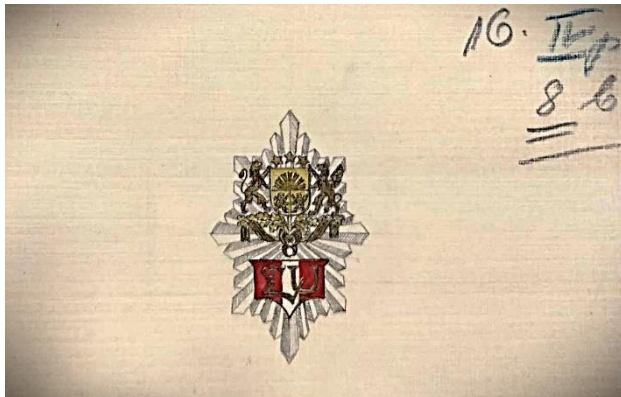
LU Akadēmiskās nozīmītes skice (4. paraugs), 1929. gadā.