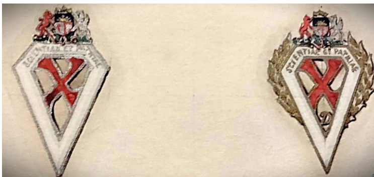
LU Akadēmiskās nozīmītes skice (3. paraugs), 1929. gadā.

Projekta apstiprināšana nebija vienkārša, jo LU rektora virzīto LU Akadēmiskās nozīmītes projektu visi LU Padomes locekļi neatbalstīja - 16 balsis PAR un 14 balsis PRET (kopā 30 balsis) (LNA-LVVA, 7427-6-213, 5).