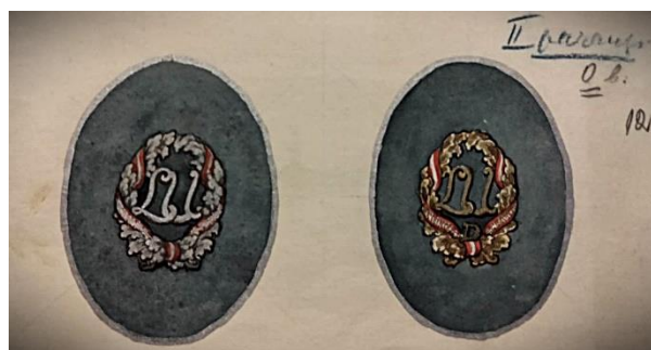
LU Akadēmiskās nozīmītes skice (2. paraugs), 1929. gadā.