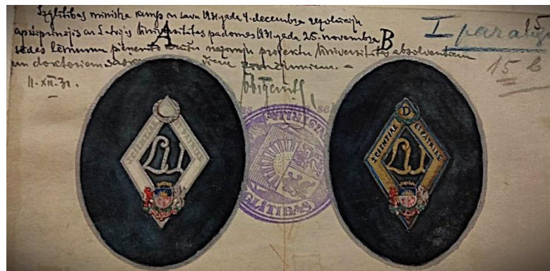
LU Akadēmiskās nozīmītes skice (1. paraugs), 1931. gadā ar Latvijas izglītības ministra apstiprinājumu.

Vēsturiski LU saviem simboliem ( LU karogam , LU rektora amata kēdei , LU himnai u.c.) pievērsās savas un Latvijas valsts 10 gadu jubilejas priekšvakarā un 1930. gados, jo 1920. gados ļoti aktuāla bija pašas Latvijas valsts nacionālās Alma mater izveide, organizēšanās un integrēšanās pēc Pirmā pasaules kara jaunajā Eiropas universitāšu starptautiskajā vidē (Ranka 2007, 7).