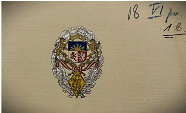
LU Akadēmiskās nozīmītes skice (6. paraugs), 1929. gadā.

LU Arhitektūras fakultātes patiesais iebildums pret LU Akadēmisko nozīmīti nebija aiz mākslinieciskiem, bet gan juridiskiem apsvērumiem - LU Padomes nevēlēšanās atzīt bijušā Rīgas Politehniskā institūta (RPI) absolventiem tiesības nēsāt RPI Akadēmisko nozīmīti (līdzīga LU Akadēmiskās nozīmītes 5. un 6. paraugiem). Izveidojoties LU, tā integrēja RPI Arhitektūras nodaļu savā struktūrā kā Arhitektūras fakultāti. Arhitektūras studenti uzskatīja par netaisnīgu aizliegt nēsāt RPI Akadēmisko nozīmīti, ja