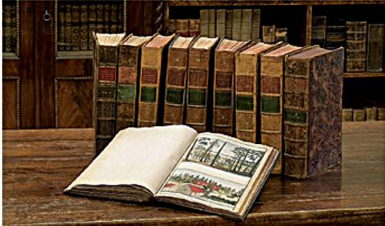
Колекція Йогана Кристофа Бротце Monument The collection of Brotze Monument

За підтримкою Фонду суспільної інтеграції у 2004 році було розроблено проект "Історичне відображення співіснування народностей, що населяють Латвію, у роботах Й. К. Бротце" і створено галерею зображень людей різних національностей, де можна побачити й українців.