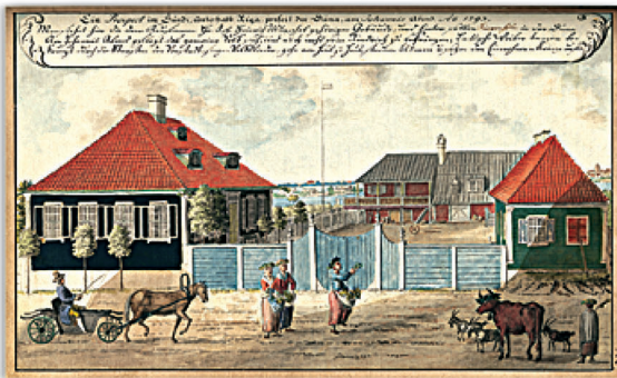
Riga. Янов вечір у Зунді. 1793

course of time, but information about them has been preserved in Brotze's drawings and descriptions stored in the library.