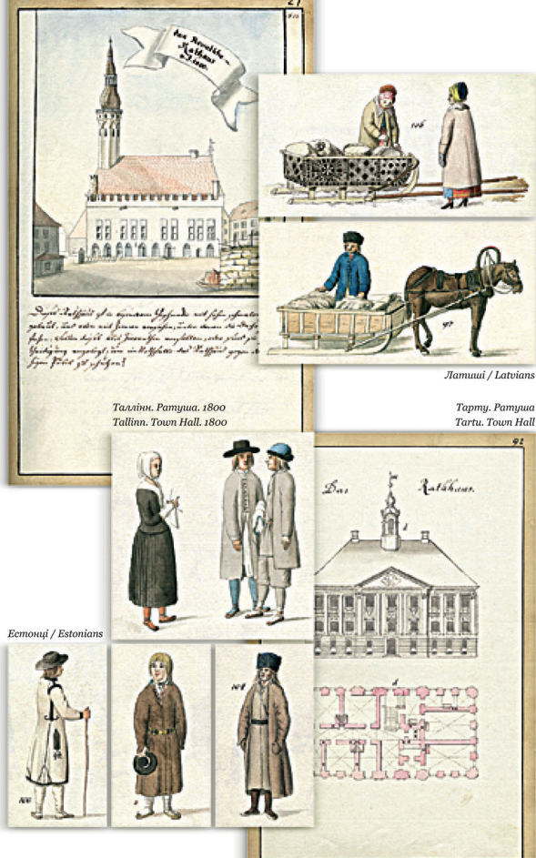
Таллінн. Ратуша. 1800 Tallinn. Town Hall. 1800

Academic Library of the University of Latvia 10 Rupniecības str., Riga, LV 1235, Latvia E-mail: acadlib@lib.acadlib.lv http://www.acadlib.lv