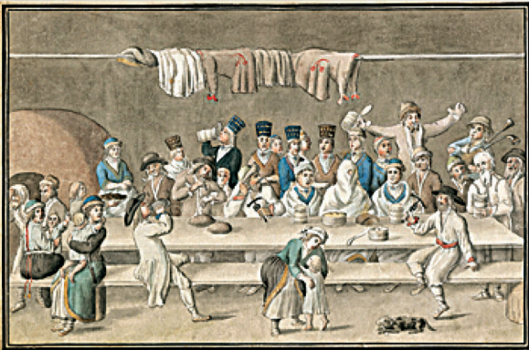
Весілля естонських селян / Estonian peasant wedding

й практичні дослідження можливостей заміни унікальних оригіналів їхніми електронними копіями.