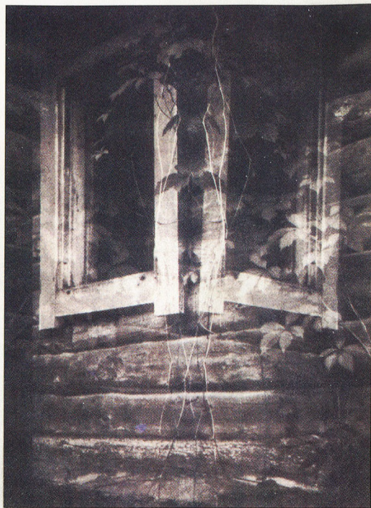
Foto/autortehnika: Helēna NUKŠA-HOFMANE [ASV] SAPYNS /TĀVA SĀTA 1991 [27,6 X 20,8 cm]

Sadarbībā ar Latvijas Fotogrāfijas muzeju atbalsta sia "J. Vītiņš un kompanjoni" "ACD – Fotoforma"