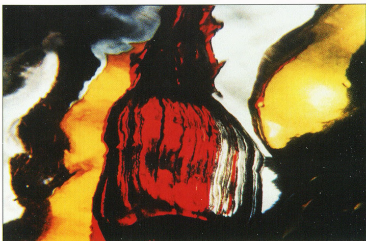
Foto/cibahrom: Dace MARGA [ASV] KOMPOZICIJA AR GAISMU #7 1990 [32,0 X 48,0 cm]