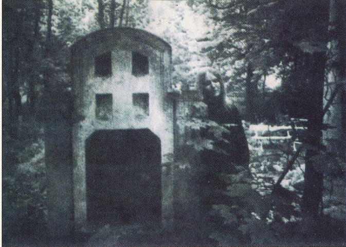
Foto/autortechnika: Helēna NUKŠA-HOFMANE [ASV] MATILDE ČERPA 1975 [16,0 X 23,2 cm]