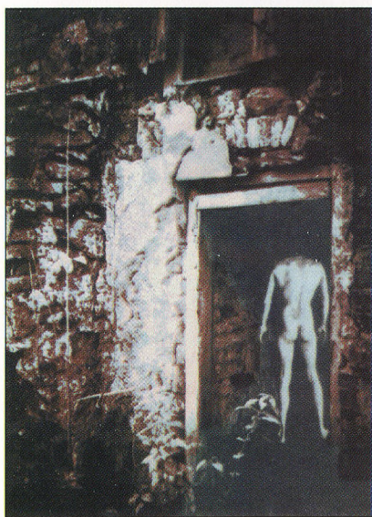
Foto/autortechnika: Helēna NUKŠA-HOFMANE [ASV] PARNĀKŠANA I 1980 [30,0 X 20,0 cm]