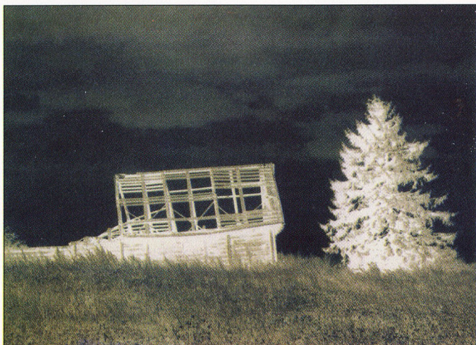
Foto/autortechnika: Helēna NUKŠA-HOFMANE [ASV] VACTĀVA FELIKSA MĀJA 1991/1992 [20,2 X 26,4 cm]