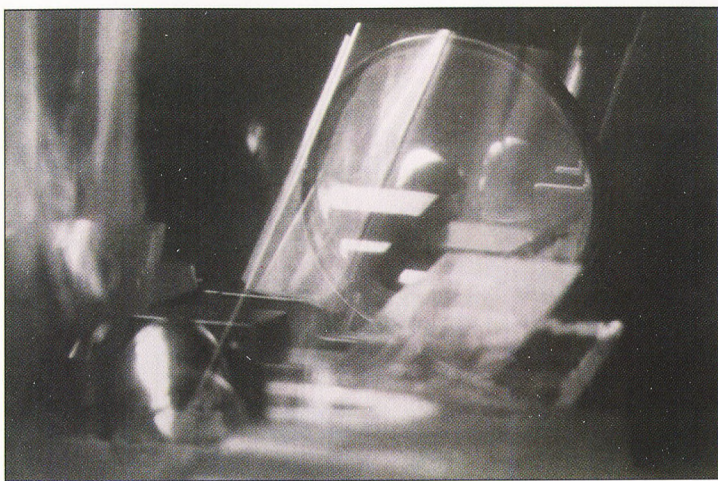
Foto/cibahrom: Dace MARGA [ASV] KOMPOZICIJA AR GAISMU #28 1992 [32,0 X 48,0 cm]