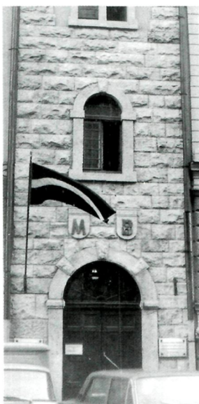
Pirmais sarkanbaltsarkanais karogs Skolas ielā (blakus Baltijas Kara apgabala štābam) pie Misiņiem 1988. gada 16. februārī.