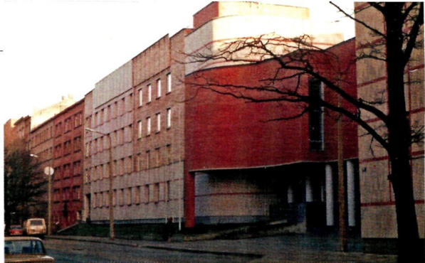
Bibliotēka Rūpniecības ielā.

Bibliotēka noturas laikmetu maiņās un kara apstākļos. Zaudējumi ir nenozīmīgi, jo darbinieki neatstāj bibliotēku bez uzraudzības ne dienu, ne nakti. Visi, kas ienāk un paliek strādāt bibliotēkā, saslīgst ar grūti ārstējamu kaiti – viņi iemil "Misiņus" ar nesavtīgu un pastāvīgu mīlestību, kad nav svarīgs ne atalgojums, ne karjeras iespējas. Būt misiņietim – to viņi uzskata par lielu godu.