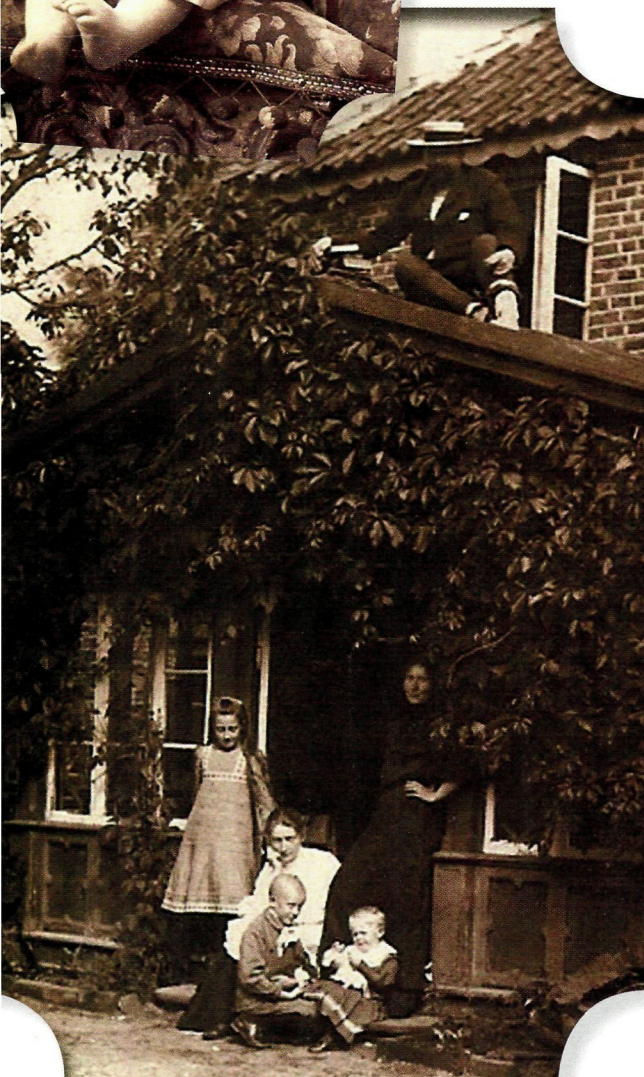
Poruku ģimene Lāčos. Dzejnieks – uz jumta.