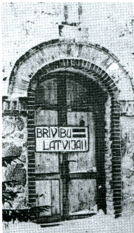
Plakāts, kas 1982. gada 1. martā bija izlikts pie Jaunraunas kapiem

Pretestības kustībai Latvijā okupācijas režīma laikā bija izteikti divi posmi. Pirmais — bruņotā pretošanās. Viena no spilgtākajām bruņotās pretestības formām bija nacionālo partizānu kustība, kas bija aptvērusi visu Latvijas teritoriju. Otrais — nevardarbīgā pretestība okupācijas režīmam. Tā sākās pēc 1940. gada 17. jūnija okupācijas un turpinājās līdz 1991. gada augusta pučam, kad Latvija atguva savu neatkarību. 2 Kā jau liecina izstādes nosaukums, tad, veidojot izstādi, galvenais akcents tika likts uz nevardarbīgu