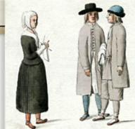
Emonuui / Estonians