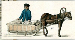
Latmuui / Latvians