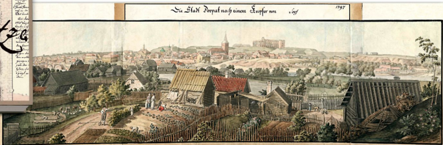
Tatu 1797/ Tartu. 1797

Preservation of Brotze's originals was very topical not long ago. Very intense use of the valuable material caused its damage and deterioration. In 1997, the Academic Library worked out a project supported by the Soros Foundation - Latvia and the Open Society Institute. The damaged volumes were restored and a digital archive of the ten volumes of Brotze's Monumente was created. It consists of 3130 pages of high quality electronic images (600 dpi). It provides the information users with the possibility to analyse details of the considerably enlarged drawings and to get reproductions equivalent to the originals. There is great demand for this collection.