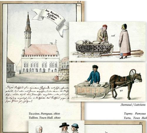
Tallinn, Pamyua, 1800 Tallinn. Town Hall. 1800

Academic Library of the University of Latvia 10 Rupniecības str., Riga, LV 1235, Latvia E-mail: acadlib@iib.acadlib.lv http://www.acadlib.lv