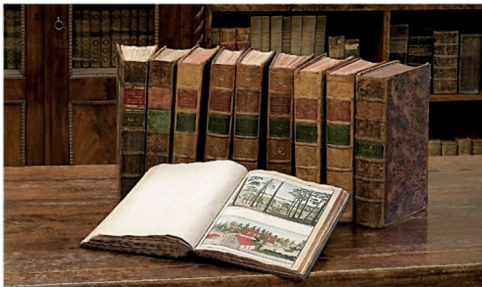
Колекція Йоганна Кристофа Бротце Monumente The collection of Broetz Monumente

За підтримкою Фонду суспільної Інтеграції у 2004 році було розроблено проєкт "Історичне відображення співіснування народностей, що населяють Латвію, у роботах Й. К. Бротце" і створено галерею зображень людей різних національностей, де можна побачити й українців.