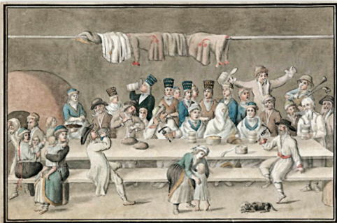
Весілля естонських селян / Estonian peasant wedding