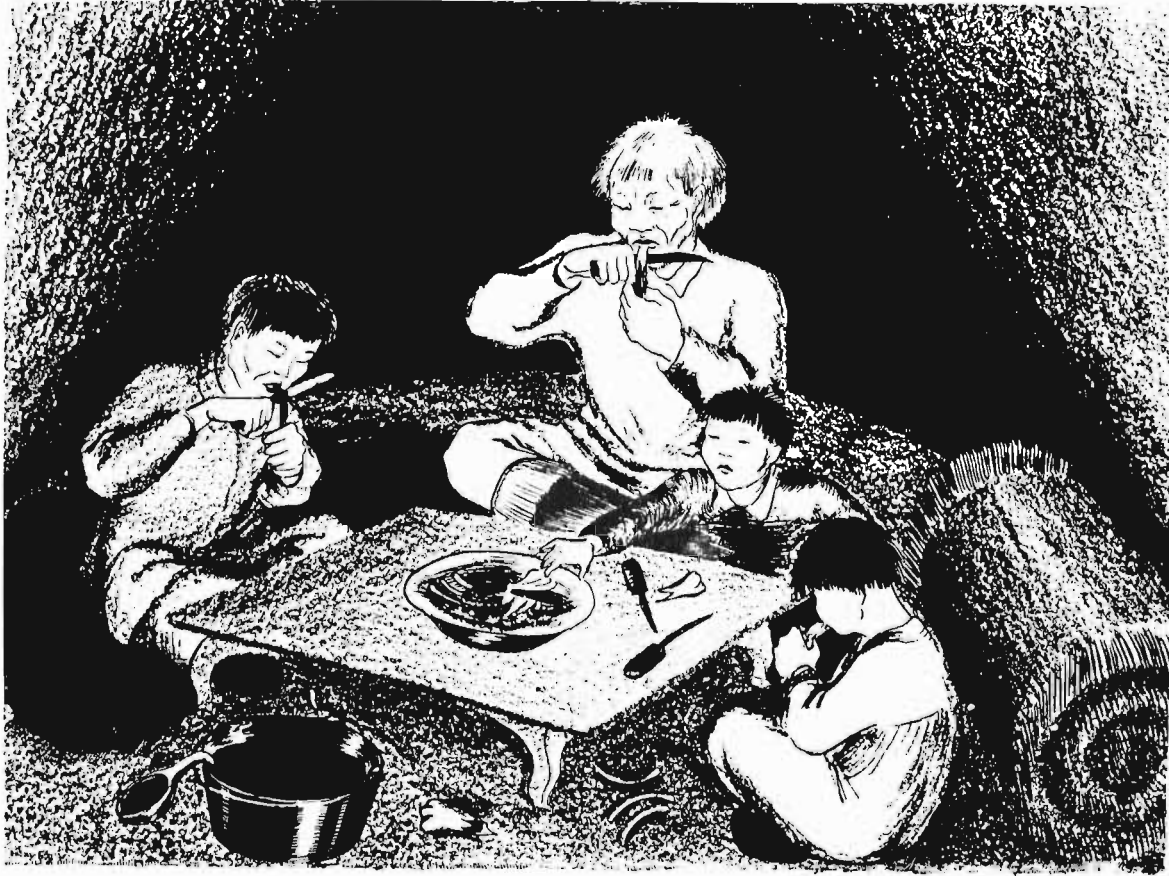
Әуке туғи ұлғау әәура.