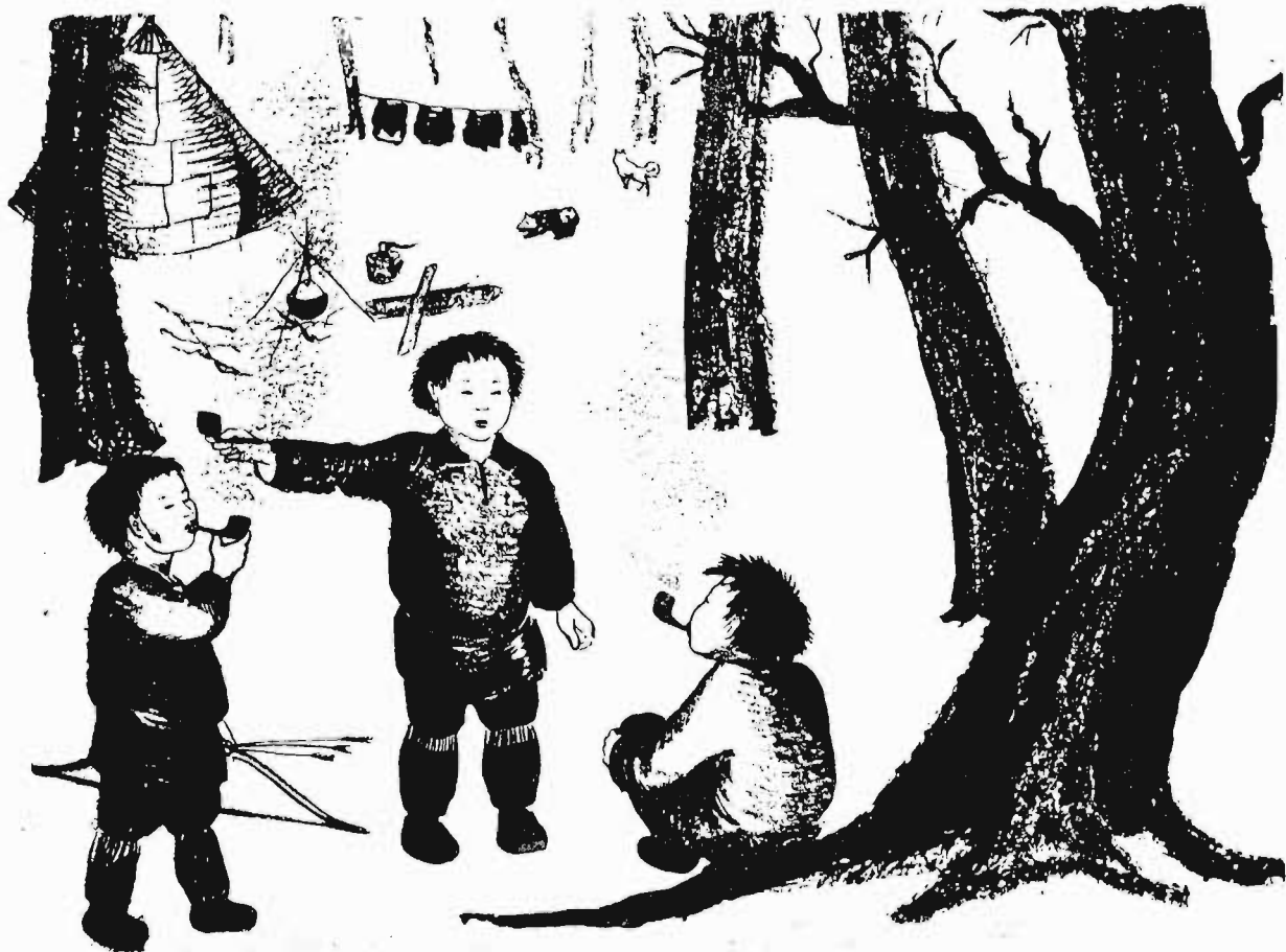
Кыгакар, танзәнал, нәрдүвәр әрүвә өвкәл.