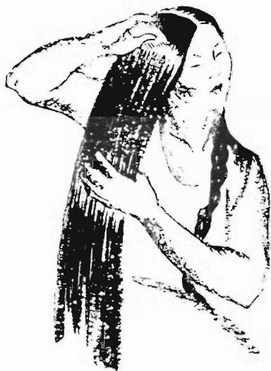
Asi kumkəldiwunzi ɟuriktələwi iɟdizərən.

Zəpildələwi ilə hanɟalwi, ɟalələwi awɟat, ədəwi ɟaɟɟacilzi ɟalələzi zəptilələwə gara. Hadiltin tugi awuwkil: nuɟartin muwə amɟalduwar gawkil, amɟalduwar mut dərələwəw, ɟalələwəw awuwkil,