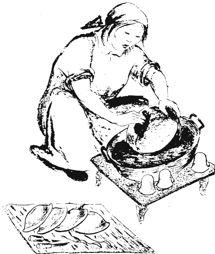
Asl upkatwa tigəlwa mut silkişaran.

Tugi 'siriktəl ilə zəptilədun iwzəḡəl. Tarit ḡinakirdu hərəkə- duk hagaduk zəptiləwə buzəḡə.