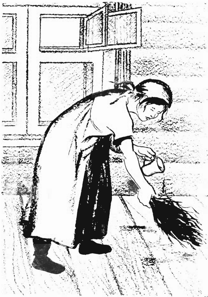
Asi dunnawa mat ulaccaran tasisanman, namna adan giuwura.

gawki. tunniwundu tunnidawi. Adawi saktawun dagadun tumnira, nuƙan dagadun taƙataci dilin ojolin tunniwki. Tuminin curgisiktalin taƙataci daradun buruwkil. Adirkar