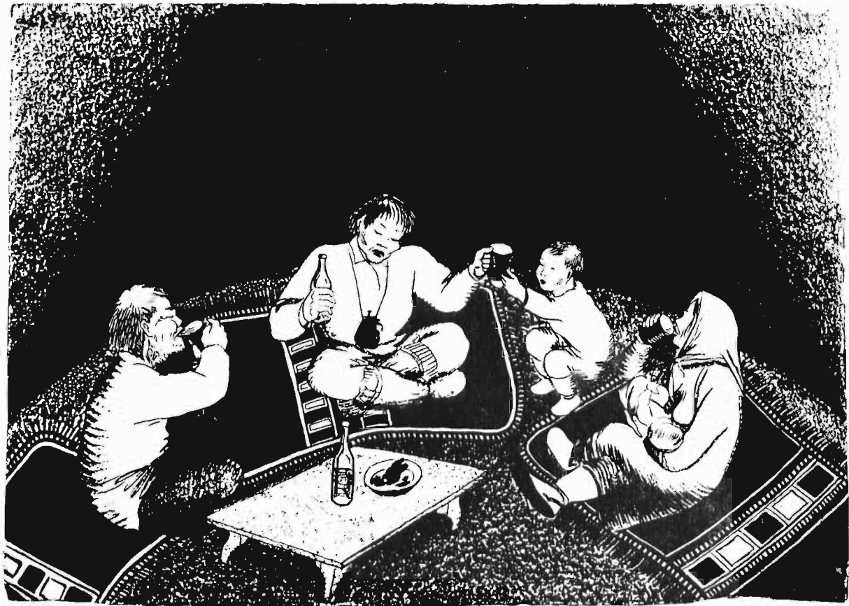
Öwko lintölwör sawkawra, araklwa umdäfin.