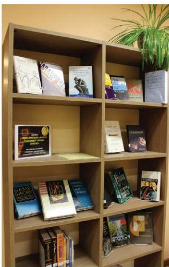
Izstāde „Nobela prēmijas laureāti ekonomikā – devums zinātnei”.