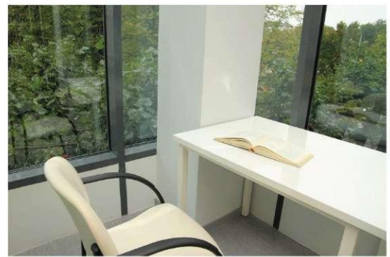
LU Bibliotēka Kalpaka bulvārī.