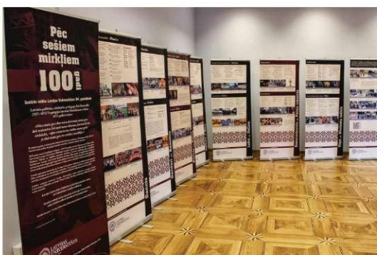
Stendu izstāde „Pēc sešiem mirkliem 100 gadi”.