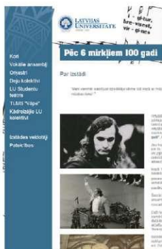
Virtuālā izstāde „Pēc 6 mirkliem 100 gadi” - www.mirkli.lu.lv