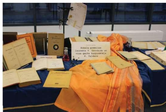
Stendu izstāde „Nobela prēmijas laureāts V. Ostvalds un viņa gaitu turpinātājs P. Valdens”.