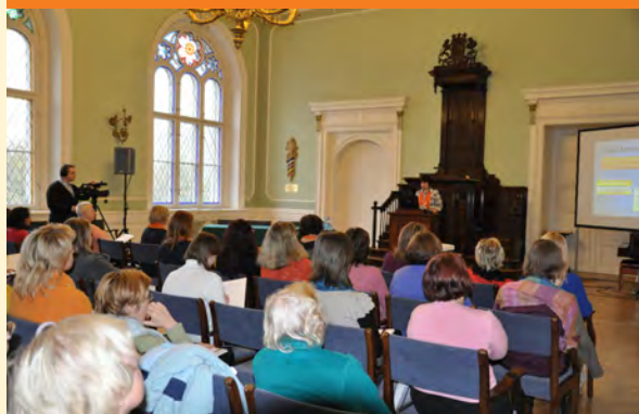
© Seminārs „Brīvpieejas e-resursu publicēšana: iespējas un attīstība”. 2012. Foto: Toms Grinbergs, LU Preses centrs.