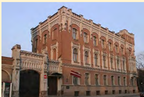
© Nams Kalpaka bulvārī 4 pirms renovācijas. Foto: Toms Grinbergs, LU Preses centrs.

Aicinām arī Jūs apmeklēt Bibliotēku Kalpaka bulvārī un iepazīt Kerkoviusa nama vēsturi. Sīkāku informāciju par iespējām pieteikties ekskursijām iespējams iegūt, rakstot uz e-pastu: info-bibl@lu.lv vai zvanot pa tālr. 67551286.