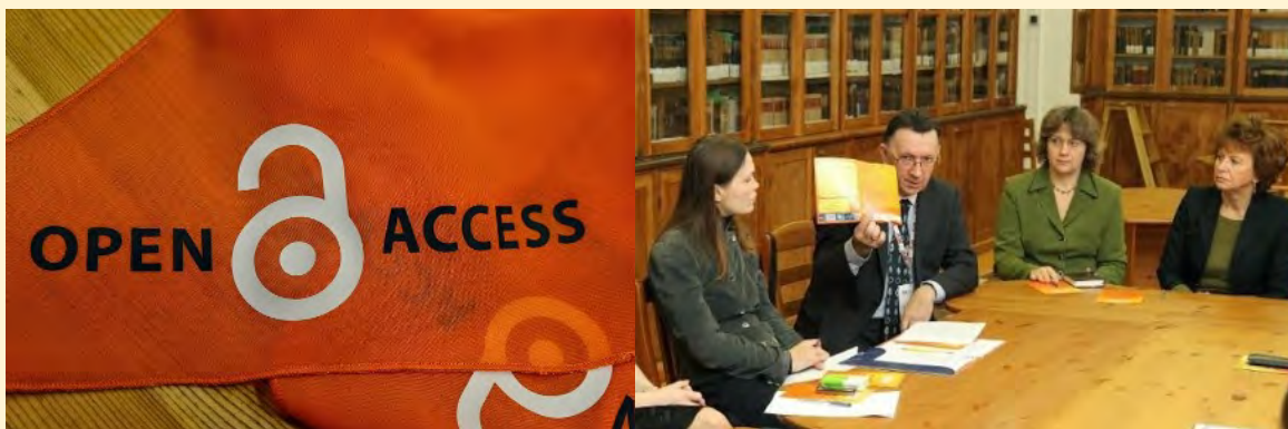
© Open Access jeb brīvpieejas kustības simbolika.

Plašāka informācija par Open Access jeb brīvpieejas kustības iniciatīvu pieejama šeit .