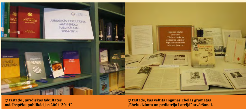
© Izstāde „Juridiskās fakultātes mācībspēku publikācijas 2004-2014”.

Grāmatas „Ebelu dzimta un pediatrija Latvijā” atvēršanas svētku fotoreportāža pieejama šeit .