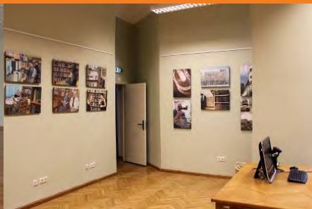
© Bibliotēkas Kalpaka bulvārī apkalpošanas zona. Foto: LU Bibliotēka.