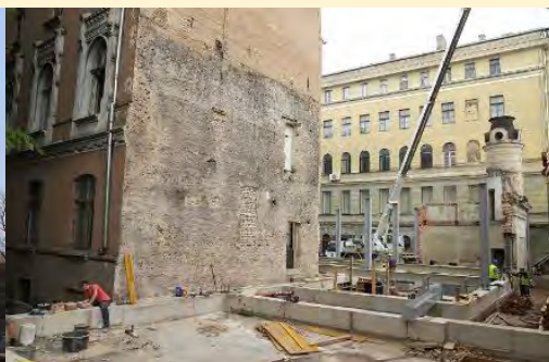
© Nams Kalpaka bulvārī 4 renovācijas laikā. Foto: Toms Grinbergs, LU Preses centrs.