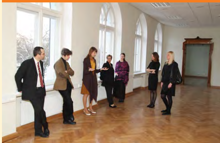
© Viena no ekskursijām atjaunotajās Kerkoviusa nama telpās. Foto: Toms Grinbergs, LU Preses centrs.