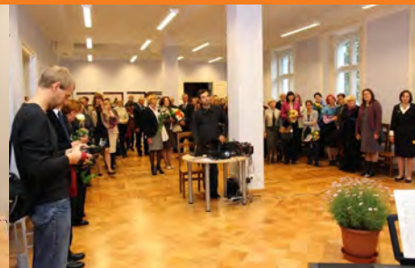
© Bibliotēkas Kalpaka bulvārī atklāšanas pasākums. Foto: LU Bibliotēka.