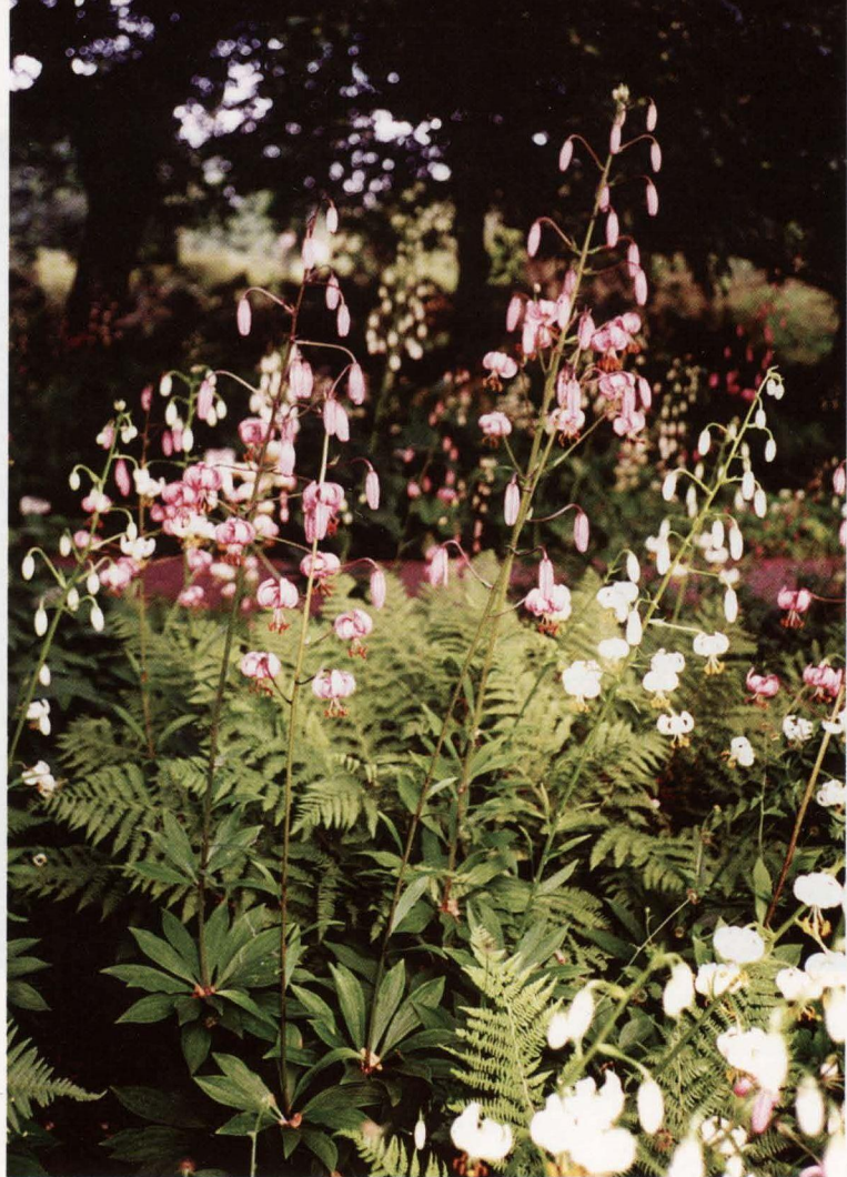
Martagonlilija ( Lilium martagon ) "Paparžu dārziņā"