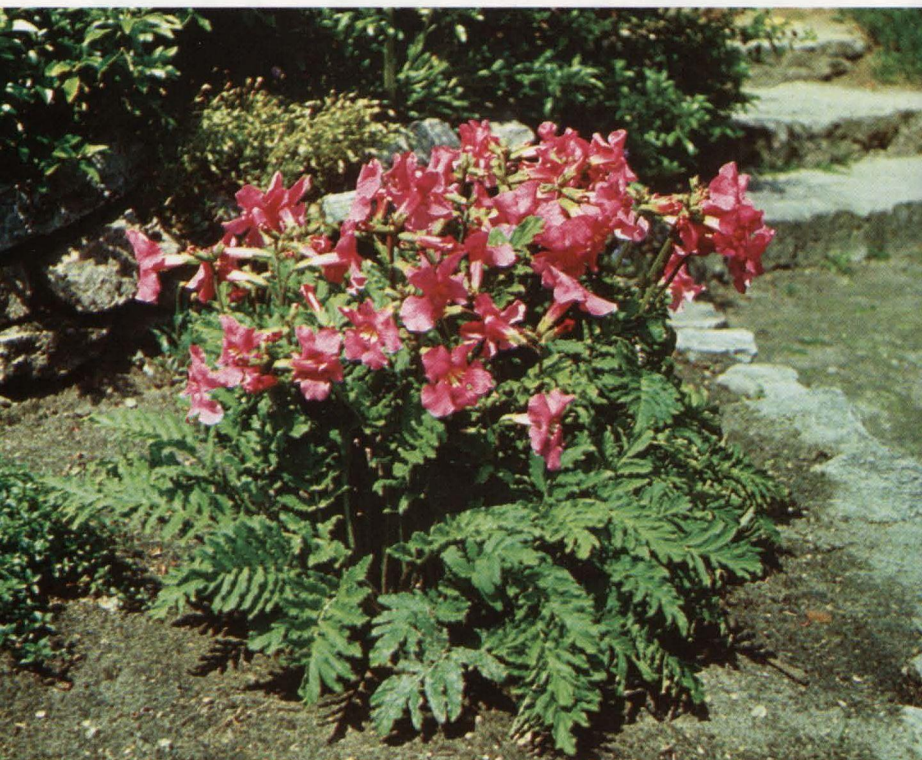
Delave inkarvileja ( Incarvillea delavayi )