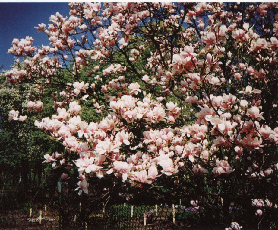
Sulanža magnolija ( Magnolia x soulangiana )