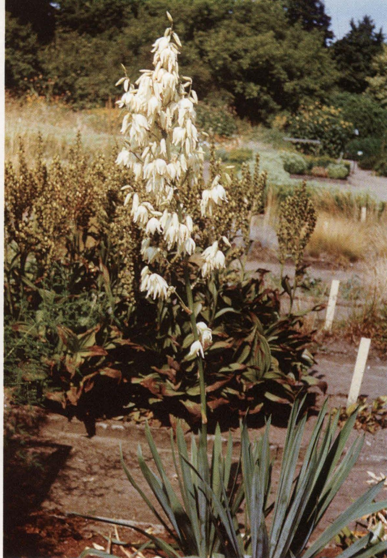
Šķiedras juka ( Yucca filamentosa )