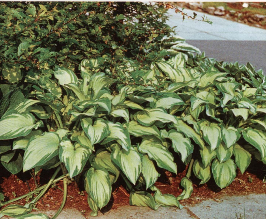
Hostu škirne ( Hosta 'Fortunei Albipicta' )