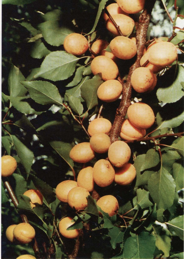
Aprikozes ( Armeniaca vulgaris ) šķirne 'Juta' (sel. I. Stražinska)