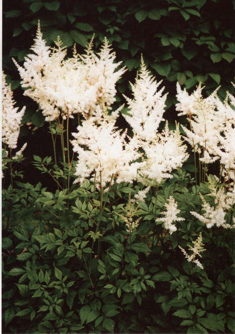
Astilbju ( Astilbe ) šķirne 'Minjona' (sel. Ā. Zorgevics)