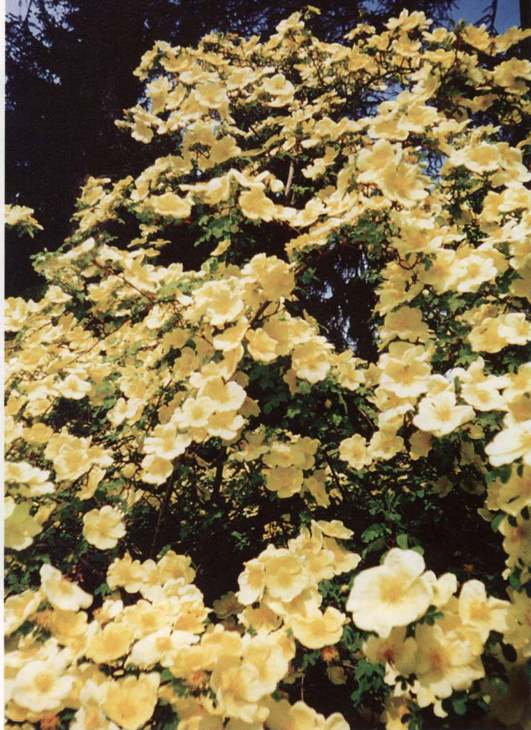
Hugona roze ( Rosa hugonis )