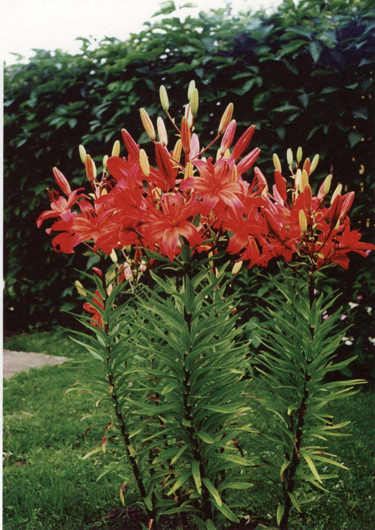
Liliju ( Lilium ) šķirne 'Krēsla' (sel. Ā. Zorgevics)