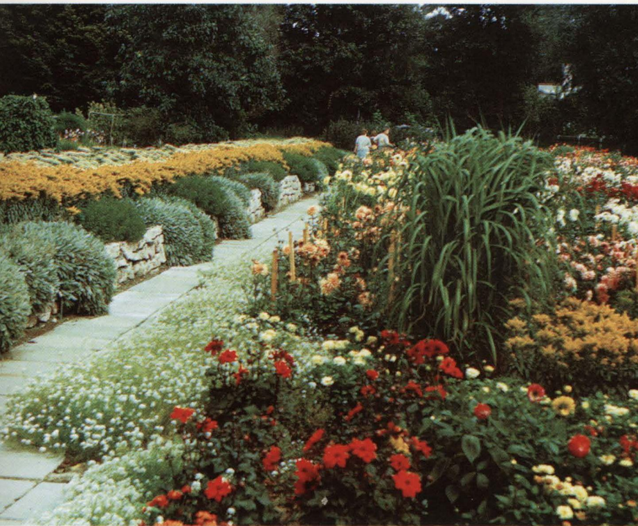
Dekoratīvi ekoloģiskās ekspozīcijas “Dāliju dārzs” fragments