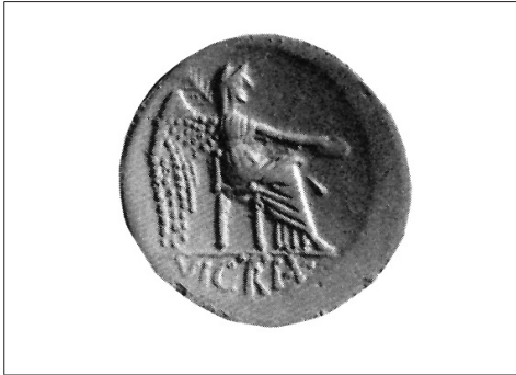
Denarius of M. Porcius Cato with Victoria Virgo