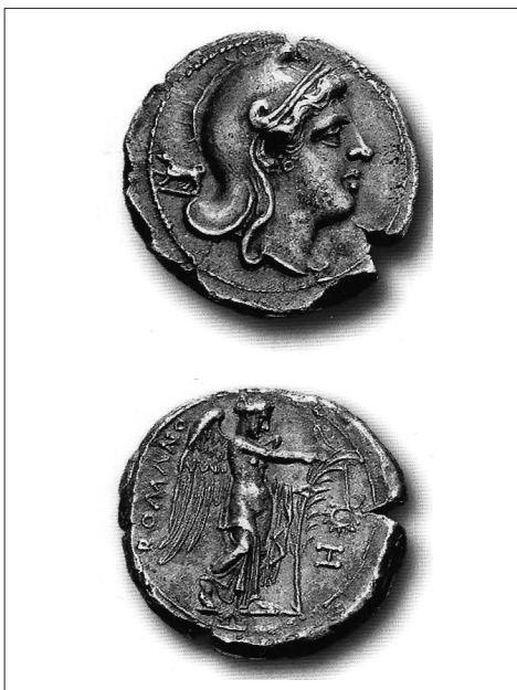
“Romano-campanian” didrachma with Victoria

But before proceeding with the said analysis, I shall at first show the great – and