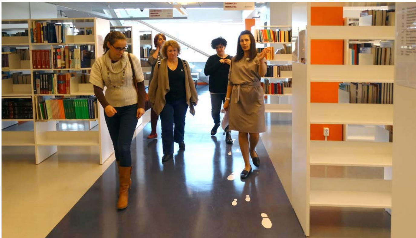
Grieķijas vieses vizītē RTU Zinātniskajā bibliotēkā.

Pavasara semestrī ar Eiropas Savienības (ES) programmas ERASMUS+ atbalstu mūs apciemoja vairāki kolēģi gan tepat no kaimiņzemes Lietuvas, gan no tālākām zemēm – Grieķijas un Turcijas. Šādas pieredzes apmaiņas laikā motivāciju un jaunas idejas darbam gūst ne tikai ārzemju kolēģi, bet arī mēs paši. Bibliotekāra profesija attīstās un mainās, līdz ar to ir būtiski uzzināt citu valstu kolēģu pieredzi, lai pilnveidotu savas kompetences un rastu jaunas idejas inovācijām. Viesiem sniedzām iespēju apmeklēt un tuvāk iepazīties ar ikdienas darbu Latvijas Universitātes (LU) Bibliotēkas Lietotāju apkalpošanas departamentā un Krājuma izmantošanas un attīstības departamentā.