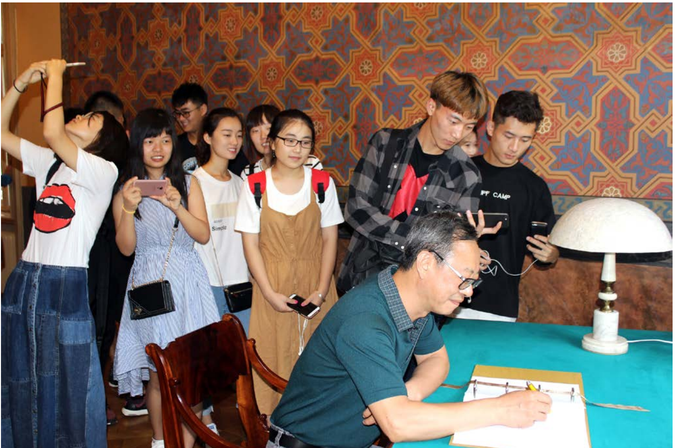
Ķīnas delegācijas pārstāvis veic ierakstu LU Bibliotēkas viesu grāmatā.

LU Bibliotēka ir gandarīta, ka var ne tikai sniegt atbalstu un jaunas idejas saviem kolēģiem, bet arī parūpēties, lai viņu iespaidi par Latviju un tās kultūru būtu pozitīvi un paliekoši!