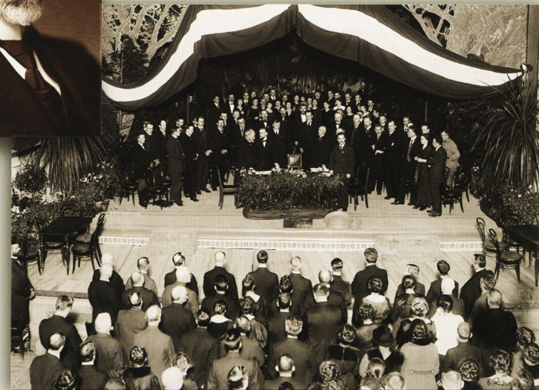
Абвяшчэнне незалежнасці Латвіі