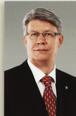
Валдіс Затлерс – Прэзідэнт Латвіі

18 лістапада 2008 г. Латвійская дзяржава святкуе сваё 90-годдзе з Дня абвяшчэння незалежнасці. Выстаўка “Беларусь-Латвія: дыялогі гісторыі, навукі і культуры” адкрываецца ў Мінску ў Нацыянальнай бібліятэцы Беларусі 29 кастрычніка 2008 г. Арганізаваная Акадэмічнай бібліятэкай Латвіі выстаўка звяртаецца да гісторыі Латвіі, раскрывае культурна-гістарычныя вытокі Латвіі і Беларусі.