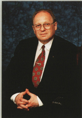
აკადემიკოსი იანის სტრადინში

საქართველოს სახელი ლატვიელებისთვის პირველად ხდება ცნობილი მე-19 საუკუნის 80-იან წლებში, როდესაც გაზეთი „დიენას ლაპა“ თავის ფურცლებზე მრავლად აქვეყნებს მოთხრობებს ტიფლისში მოგზაურების შესახებ. 1904-1906 წლებში რიგის რუსული თეატრის რეჟისორი ცნობილი ქართველი თეატრალური მოღვაწე კოტე მარჯანიშვილი იყო. რიგაში „სოლომენკას“ ცირკის ადმინისტრატორის თანამდებობაზე მრავალი წლის მანძილზე ქართველი გიორგი შეანგირაძე მუშაობდა. 1905 წელს გიორგი შეანგირაძემ რიგაში გახსნა პირველი კინოთეატრი - "Royal Bio". 1929 წელს დაარსდა კავკასიელთა პირველი საზოგადოება „იგერია“, რომელსაც მოგვიანებით „კავკასია“ ეწოდა. საზოგადოება იღწოდა, რათა რაც შეიძლება მეტ ადამიანს მოესმინა ლექციები ქართულ სწლოვნებაზე, ისტორიასა და პოლიტიკურ მოვლენებზე. ამავდ დროს საქართველოში ცხოვრობდა, მოღვაწეობდა ან სამკურნალოდ ჩადიოდა ბევრი ცნობილი ლატვიელი მწერალი: იანის ეზერინში, პავილს როზიტისი, ერნესტ ბირზნიეკს-უბიტისი, იანის იაუნსუდრაბინში და ლინარდ ლაიცენისი. საქართველოში გასტროლების დროს დიდი მოწონება და მაღალი შეფასება დაიმსახურა ბრწყინვალე ლატვიელმა მომღერალმა მილდა ბრეჰმანე-შტენგელემ. ლატვიის საპატიო კონსული საქართველოში და ლატვიელთა საზოგადოების „Ave Sol“ თავმჯდომარე, პროფესორი რეგინა იაკობიე იკვლევდა ფარმაკოლოგ რობერტ კუფცისის მოღვაწეობას საქართველოში.