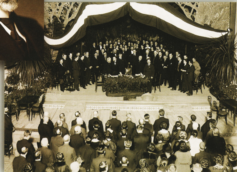
ლატვიის დამოუკიდებლობის დეკლარაცია.