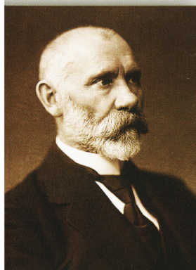
იანის ჩაკსტე (1859-1927) ლატვიის პირველი პრეზიდენტი (1922-1927).

2007 წლის 18 ნოემბერს ლატვია აღნიშნავს დამოუკიდებლობის გამოცხადების 89-ე წლისთავს. 2007 წლის 15 ნოემბერს საქართველოს მეცნიერებათა ეროვნულ ბიბლიოთეკაში გაიხსნება გამოფენა „ლატვია საქართველო: გუშინ, დღეს, სვალ.“ გამოფენა, რომელიც ლატვიის აკადემიური ბიბლიოთეკის მიერაა ორგანიზებული, გაძლევთ საშუალებას გაეცნოთ ლატვიის ისტორიას, საქართველოსა და ლატვიის კულტურულ ურთიერთობათა ფესვებს, ამ ორი ქვეყნის საერთო გზას ევროგაერთიანებისკენ.